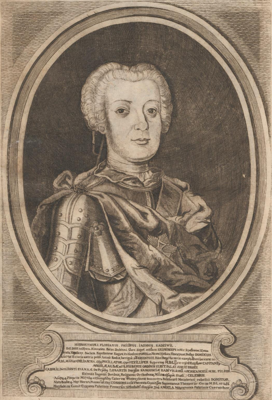
Portret Hieronima Floriana Radziwiłła, Hirsz Leybowicz, 1747-1758