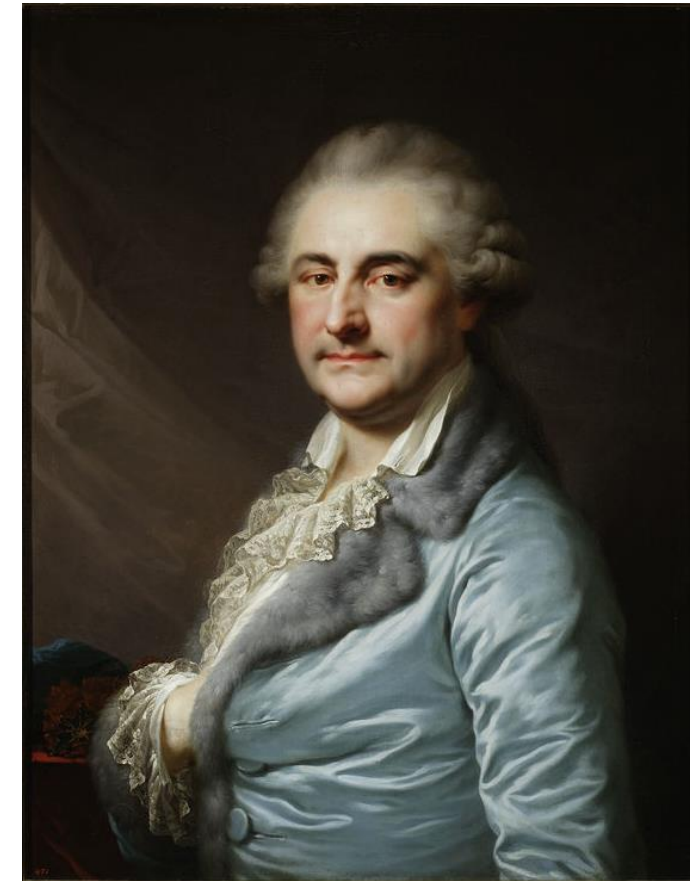
Portret Stanisława Augusta w szlafroku, Jan Chrzyciel Lampi, 1788-1789