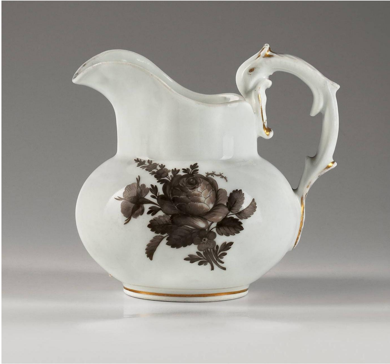
Mlecznik, Korzec, 1820-1830