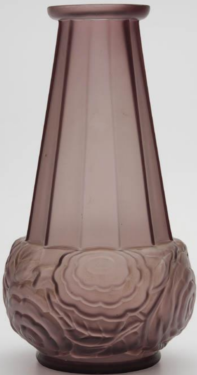
Wazon, ok. 1920-1939, Huta Szkła J.Stolle "Niemen"