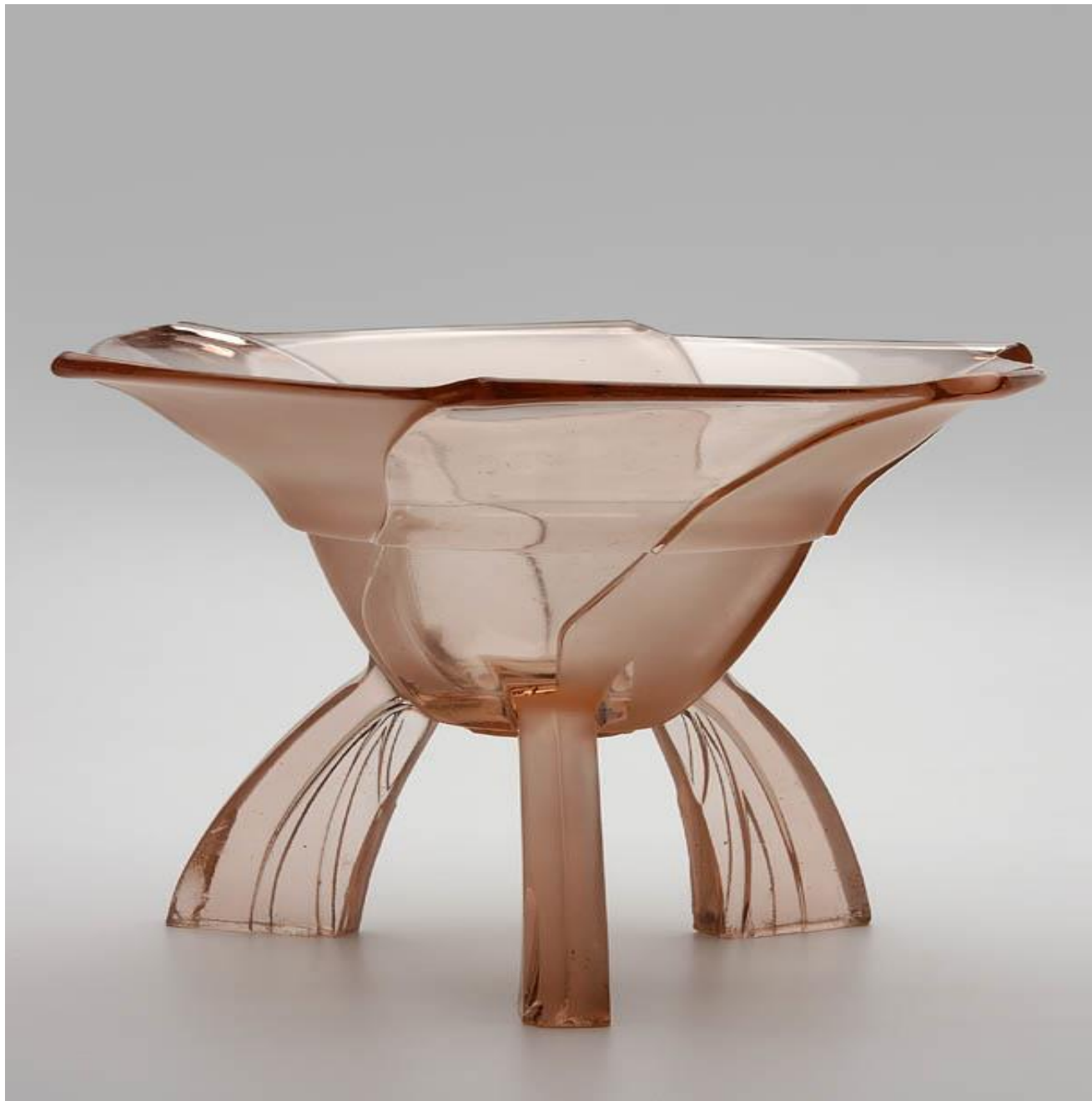
Wazon, ok.1930-1939, Huta Szkła J.Stolle “Niemen”