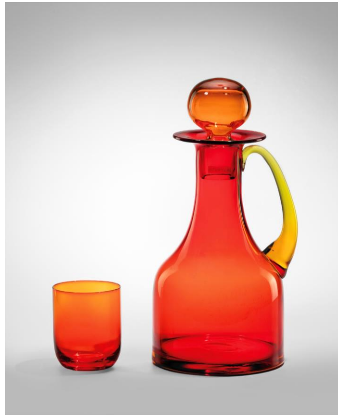
Szklanka i karafka oranżowa, 1975-1985