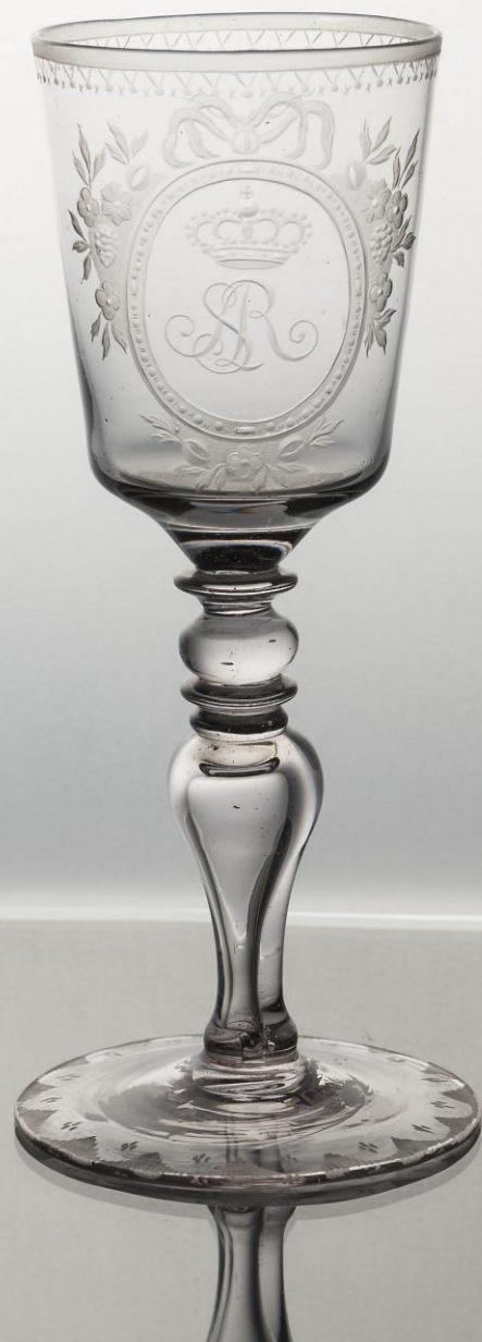
Kielich, 1764-1798, Huta Szkła Naliboki