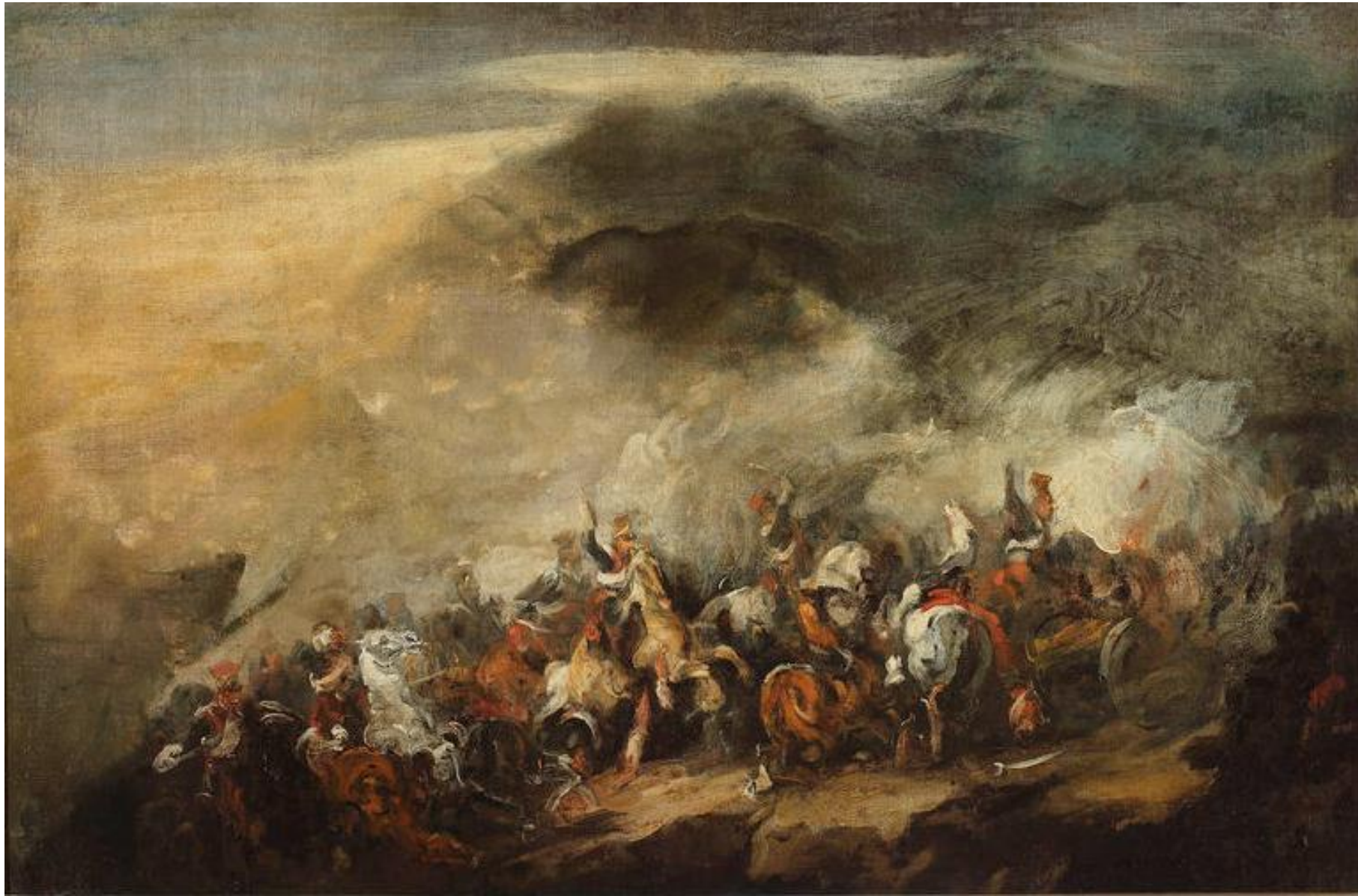
Bitwa pod Somosierrą , Piotr Michałowski, 1840-1844