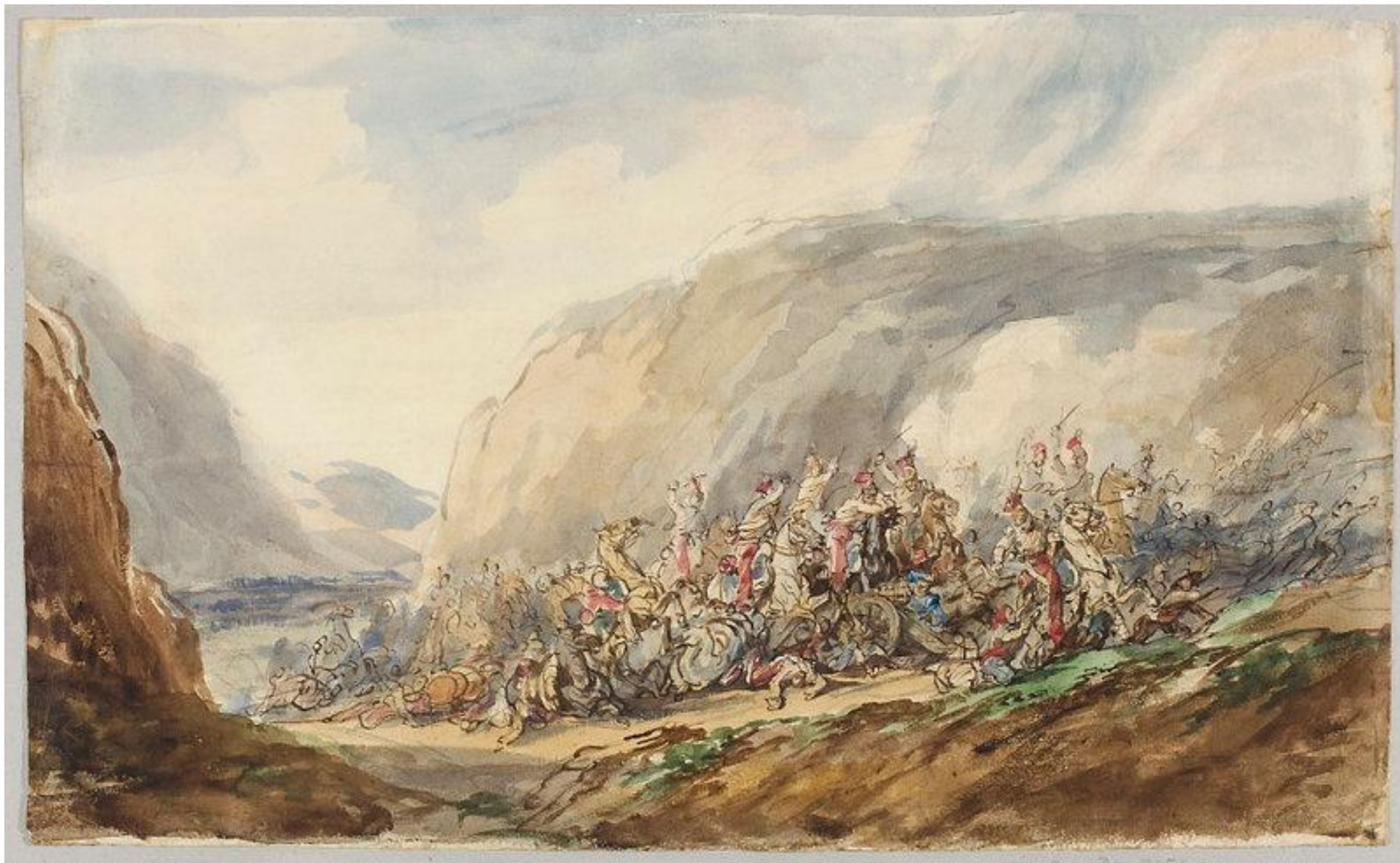
Szarża w wąwozie Somosierry, Piotr Michałowski, 1833-1837