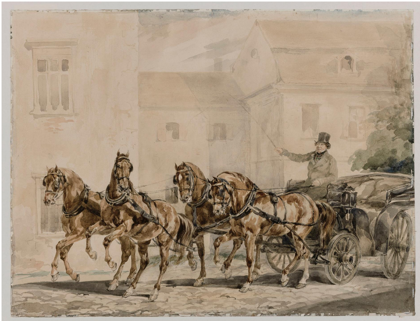
Ekwipaż przed pałacem Wielopolskich w Krakowie, Piotr Michałowski, 1835 -1837