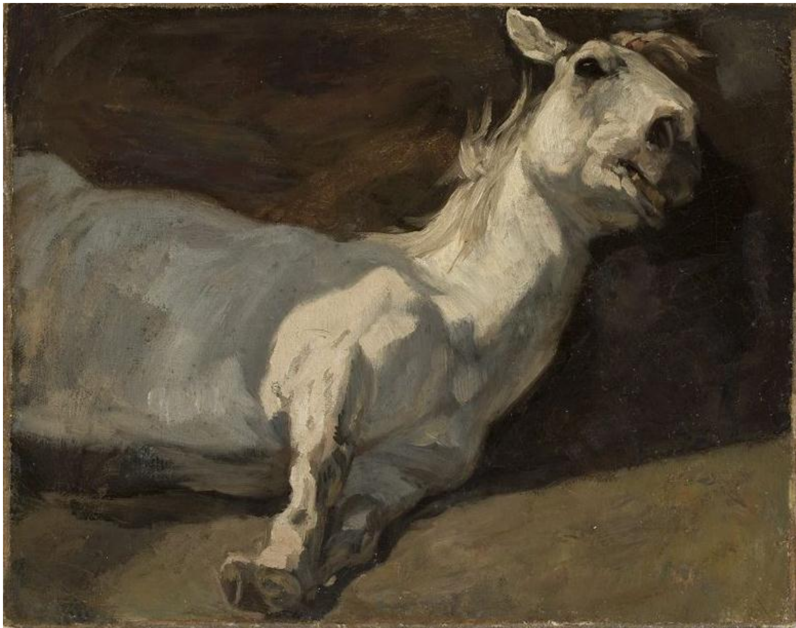
Leżący biały koń, Piotr Michałowski, ok. 1830-1850