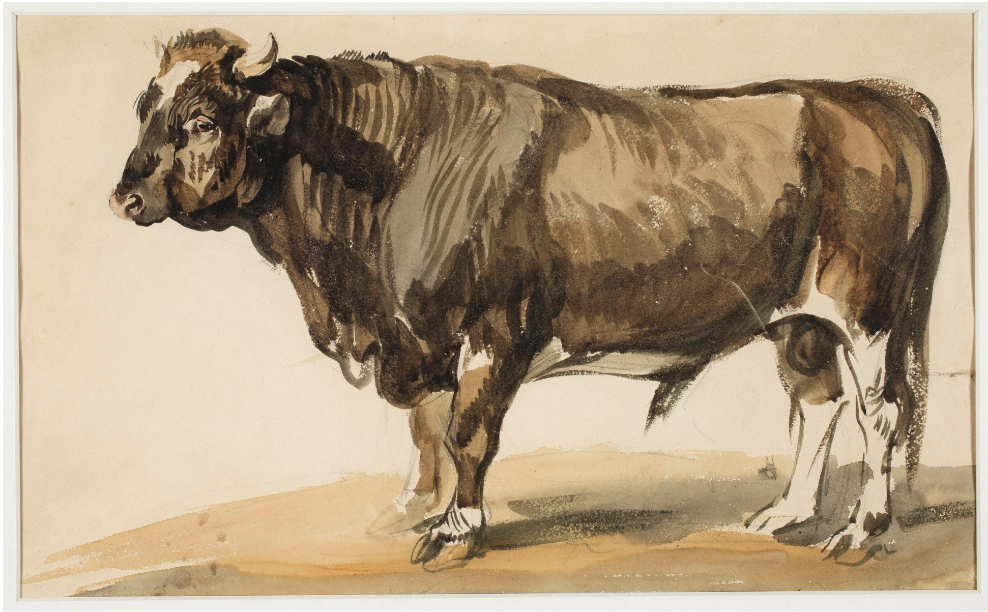
Byk , Piotr Michałowski, 1840-1848