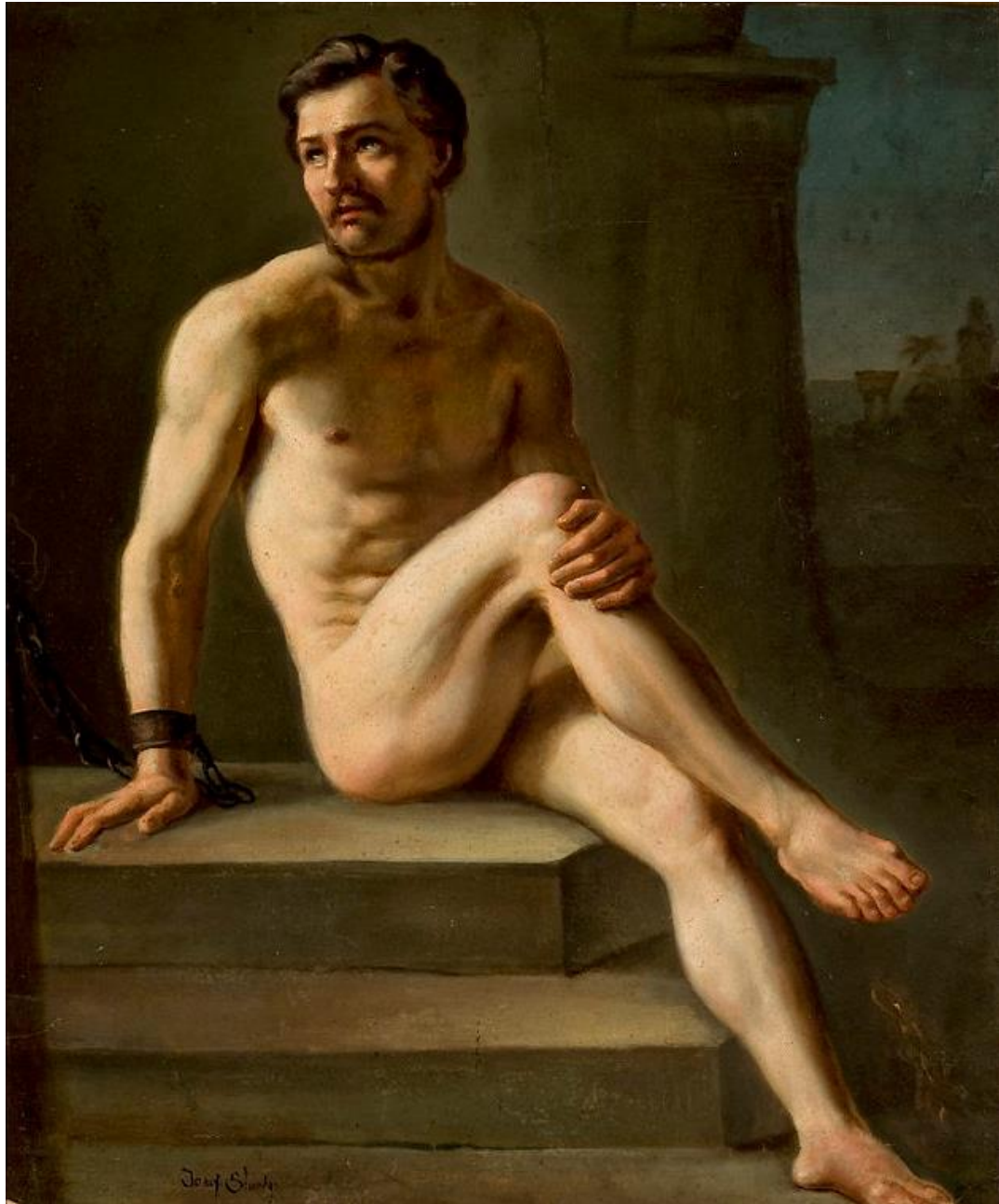
Studium aktu męskiego, Józef Simmler, ok. 1841-1842