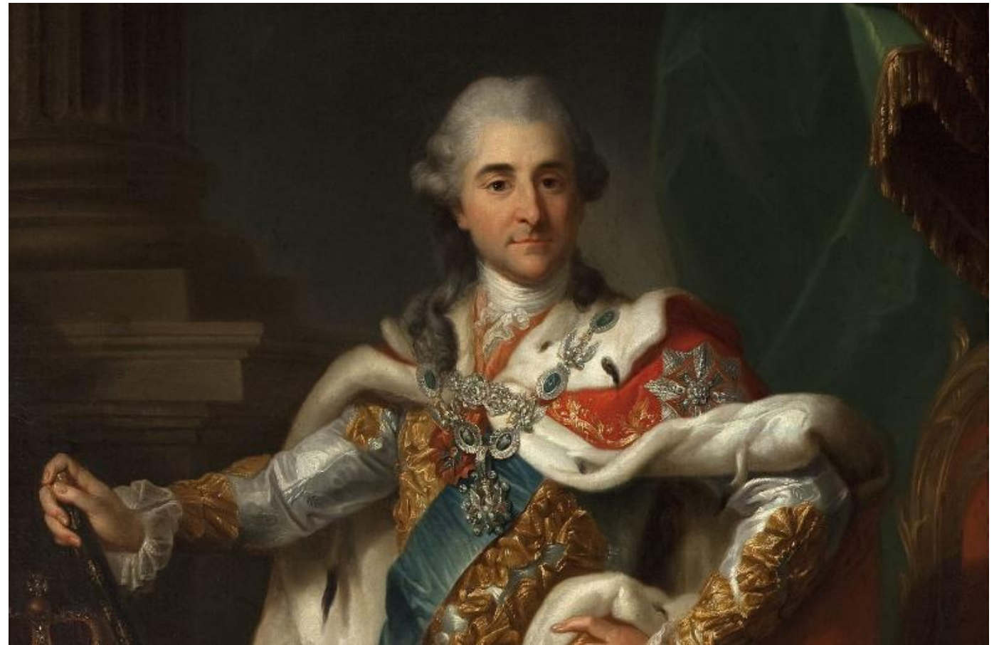
Portret Stanisława Augusta Poniatowskiego w stroju koronacyjnym, Marcello Bacciarelli (warsztat), ok. 1767-1771