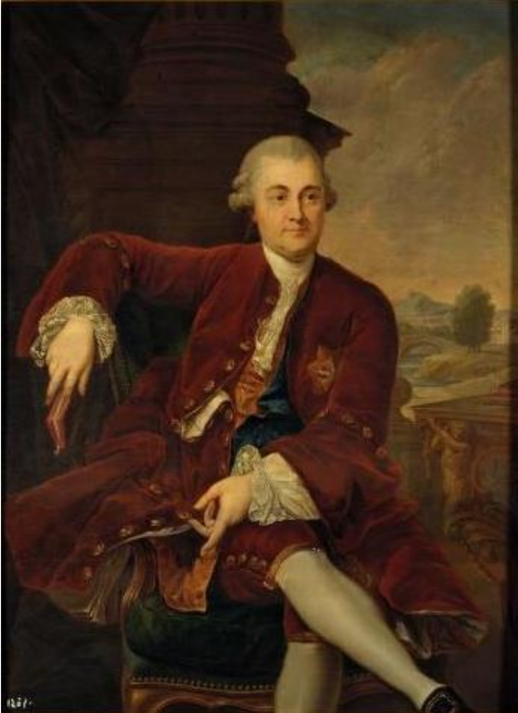
Portret Kazimierza Poniatowskiego, brata króla, Marcello Bacciarelli, ok. 1762-1764