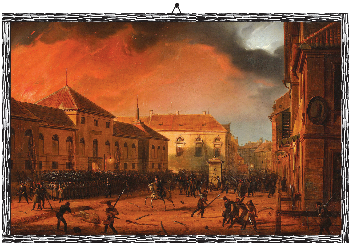
Marcin Zaleski, Wzięcie Arsenatu , 1831, MNW

Na obrazie ukazany jest szturm na Arsenał w nocy z 29 na 30 listopada 1830 roku. Biorą w nim udział zwykli mieszkańcy Warszawy oraz żołnierze 4. pułku piechoty armii Królestwa Polskiego. Zdobycie składu amunicji i opanowanie terenu Starego Miasta zdecydowało o początkowym sukcesie powstania w Warszawie. Data Nocy Listopadowej widnieje na afiszu na ścianie budynku po prawej stronie.