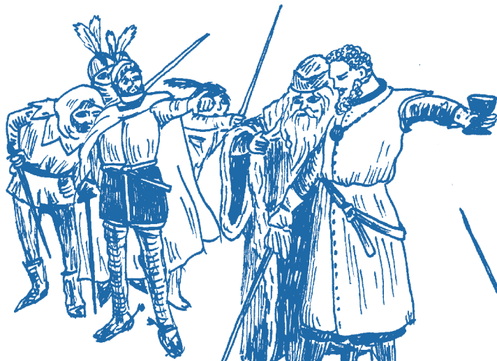
Michał Elwiro Andrioli, Śmierć Konrada Wallenroda, rysunek, 1891

Bohater utworu Adama Mickiewicza, żyjący wśród wrogów, niespodziewanie mści się na ciemnościach swojej ojczyzny. Powstańców listopadowych można porównać do Wallenroda – zamierzali zabić wielkiego księcia Konstantego, który mieszkał w Belwederze.