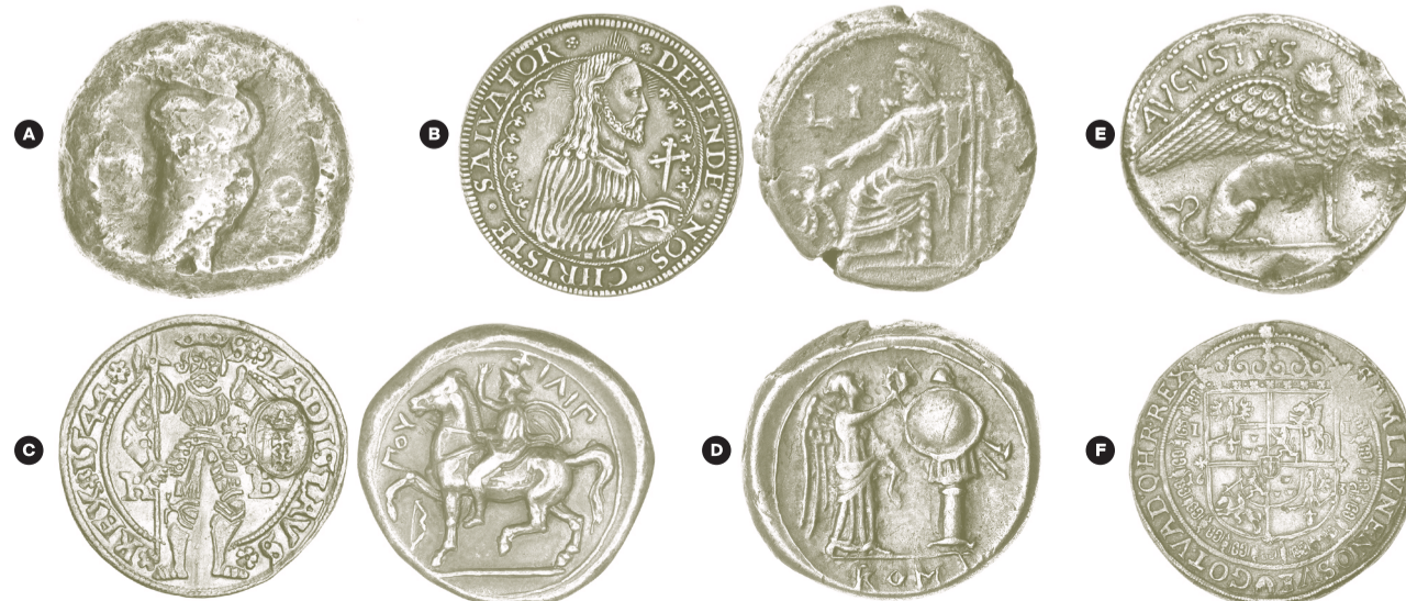
A. tetradrachma, Ateny / B. talar gdański – obelężniczy i tetradrachma bilonowa Hadriana / C. dukat węgierski z kontrasygnatą Gdańską z 1577 r. i tetradrachma Filipa II Macedońskiego / D. wiktoriał, Republika Rzymska / E. tetradrachma cystoforyczna Augusta / F. półtalar koronny Władysława IV Wazy; godła Polski i Litwy, tarcza herbowa Szwecji i w centrum Snopek Wazów.