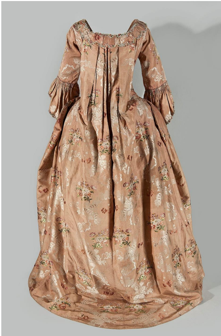
Suknia robe a la française, poł. XVIII w.