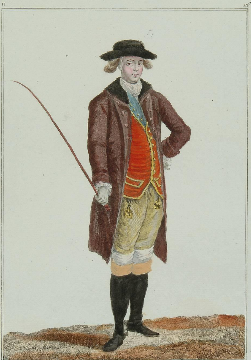
Redingotte à colet et à bavaroise un peu ajustée pour monter à cheval, veste du matin à bavaroise bordée d'une treille à l'Anglais et culotte de peau.

A Paris chez Bernaute et Rapilly rue St. Jacques, à la Ville de Coustances. A. P. D. R.