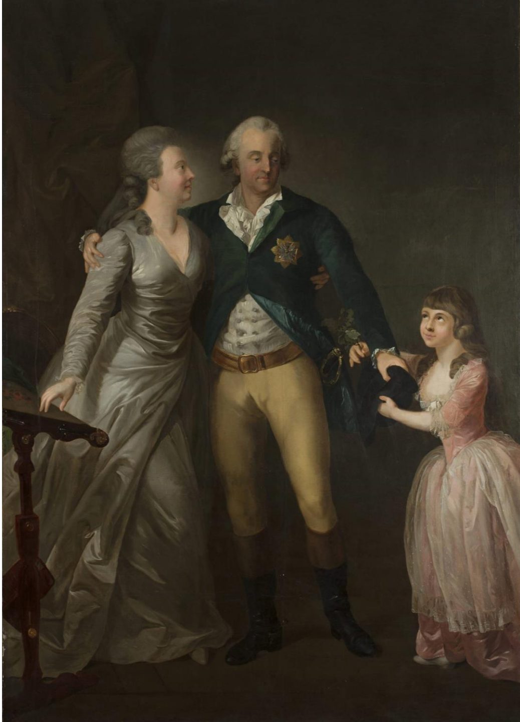
Portret księcia Karola Augusta saskiego z żoną Zofią i córką, Anton Graff, XVIII w.