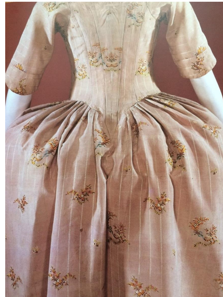
Suknia typu robe a l'anglaise, 1780-85