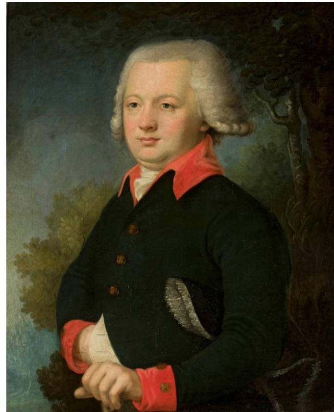
Portret młodego mężczyzny, Vladimir Borovikovsky, XVIII w.