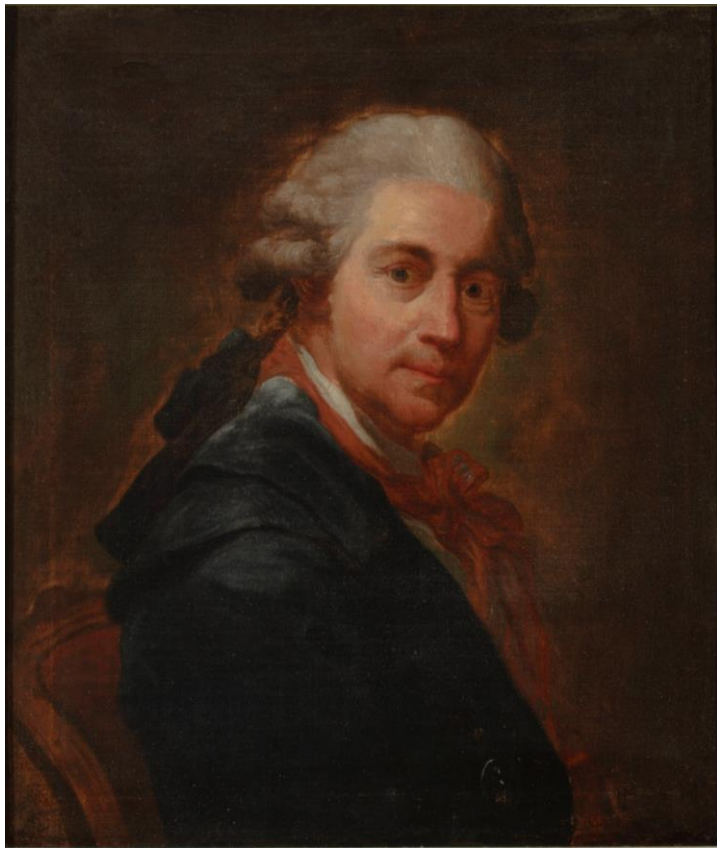
Autoportret Bacciarellego w redingocie, Marcello Bacciarelli (warsztat), koniec XVIII w.