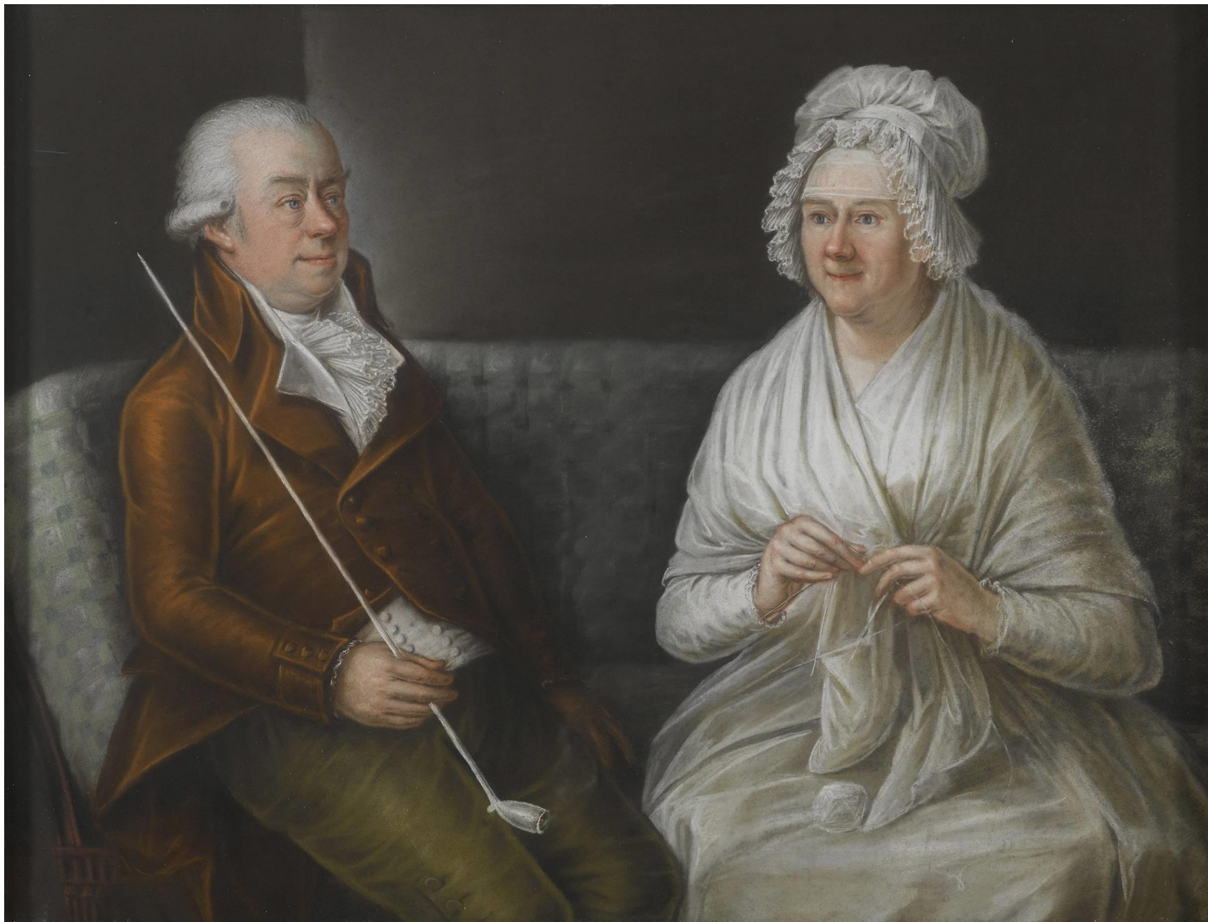
Portret dwojga staruszków, Malarz nieznany, koniec XVIII w.