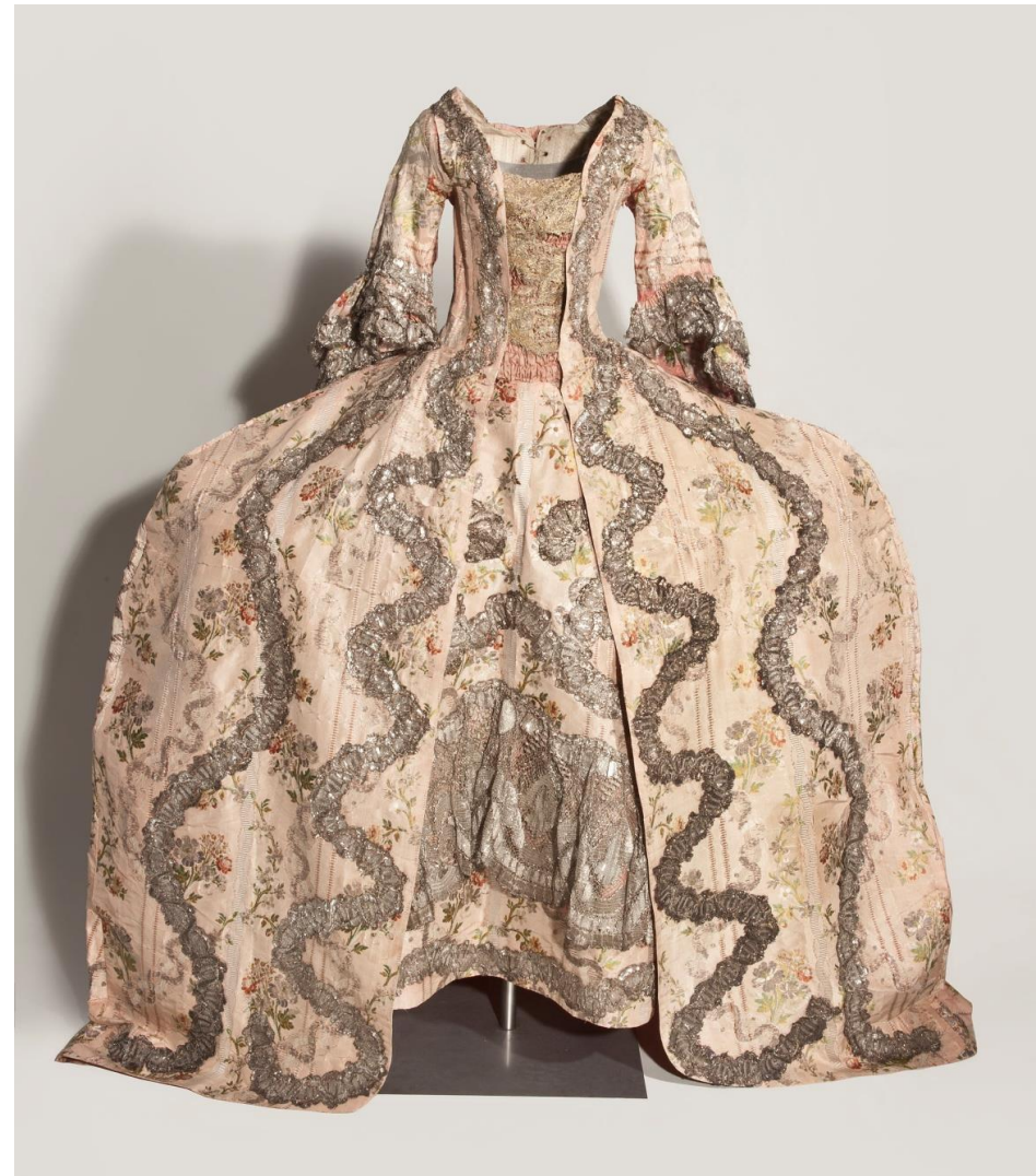
Suknia w typie grand habit, II poł. XVIII w.