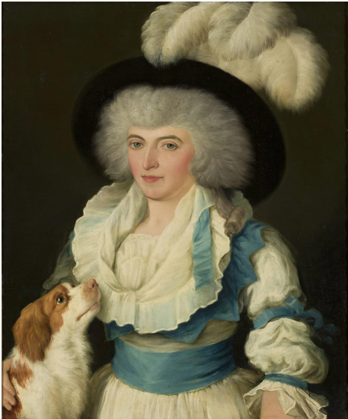
Portret kobiety z psem, Malarz nieznany, II poł. XVIII w.