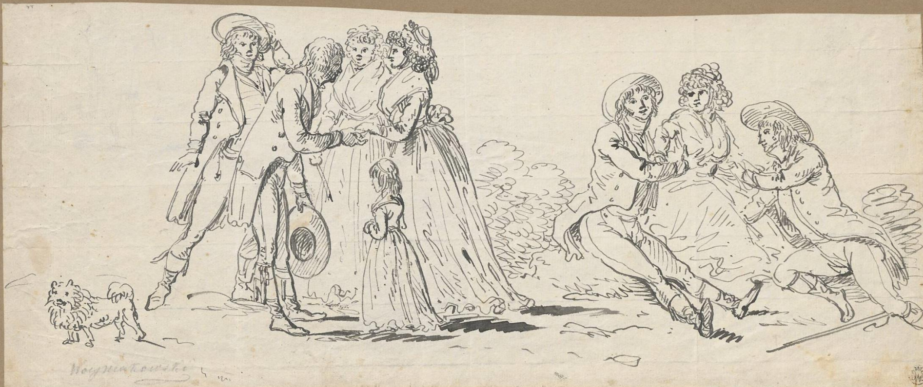
Scena rodzajowa, Kazimierz Wojniakowski, ok. 1797