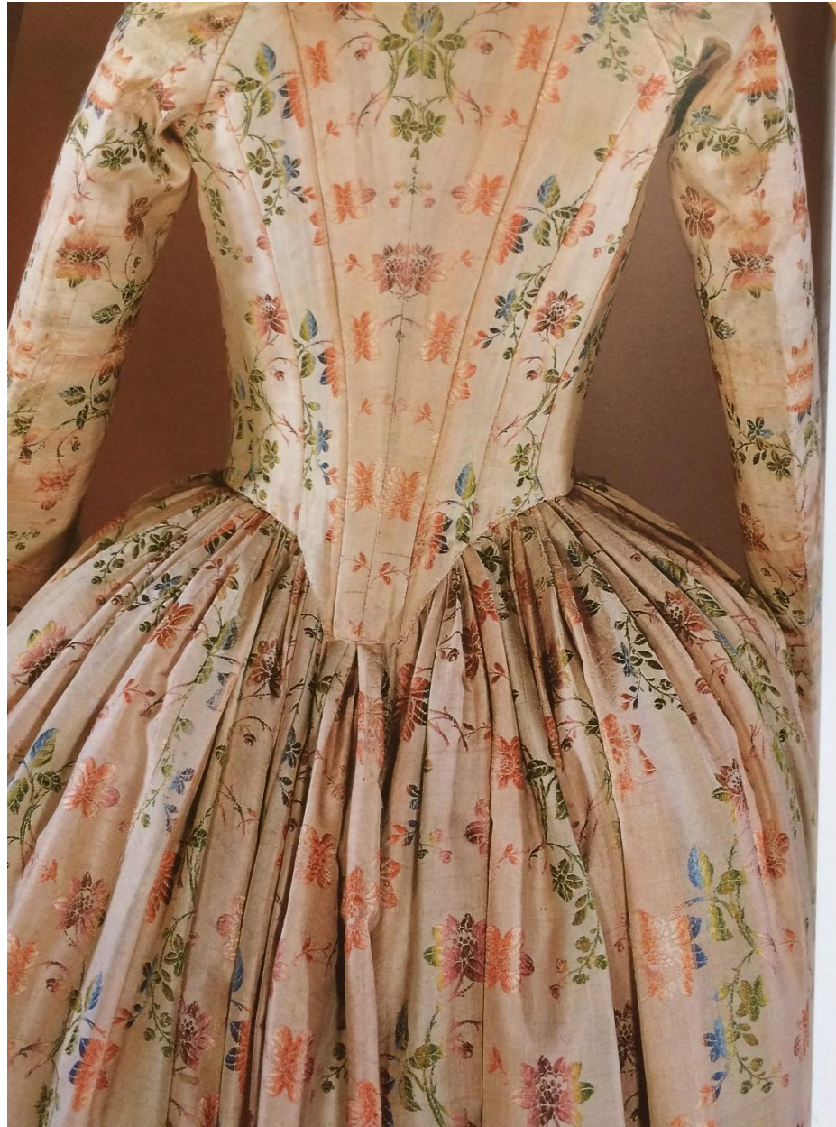
Suknia robe a la anglaise, lata 80 XVIII w.