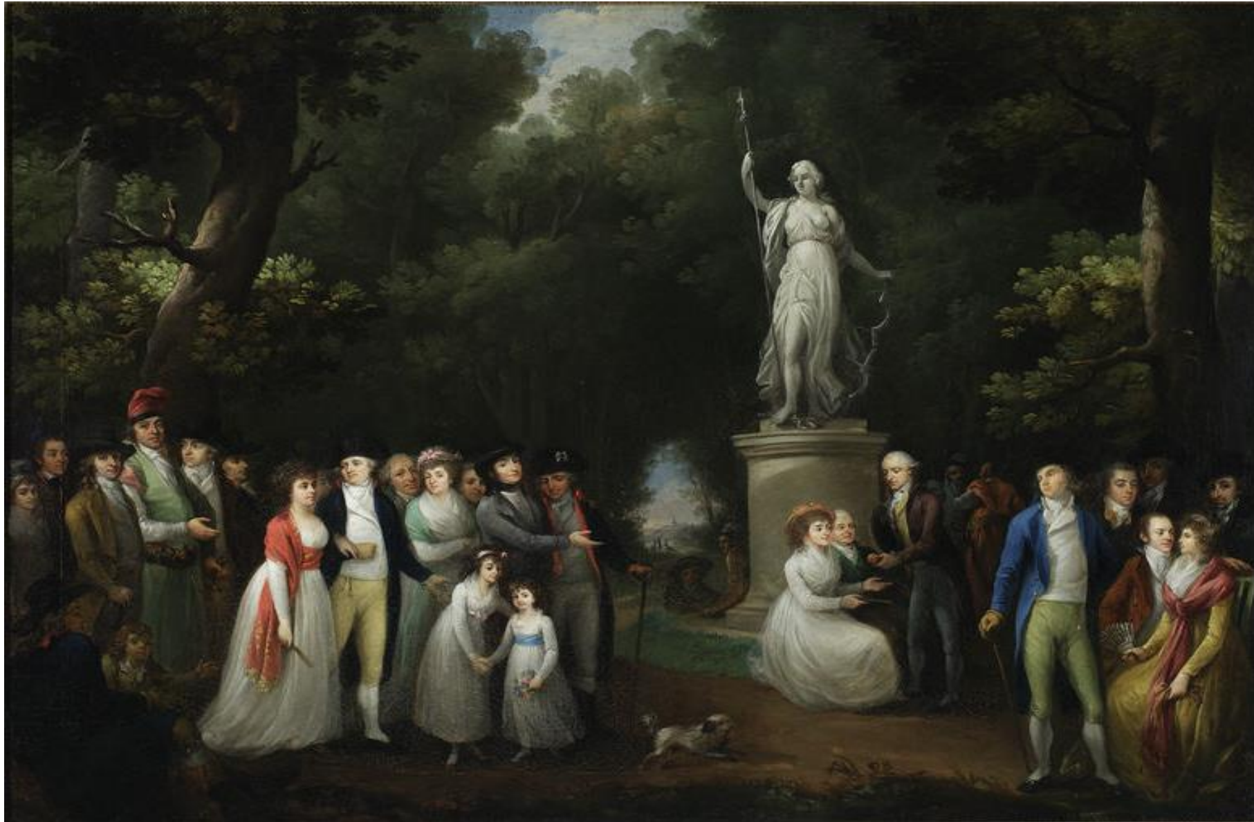
Zebranie towarzyskie w parku, Kazimierz Wojniakowski, 1797