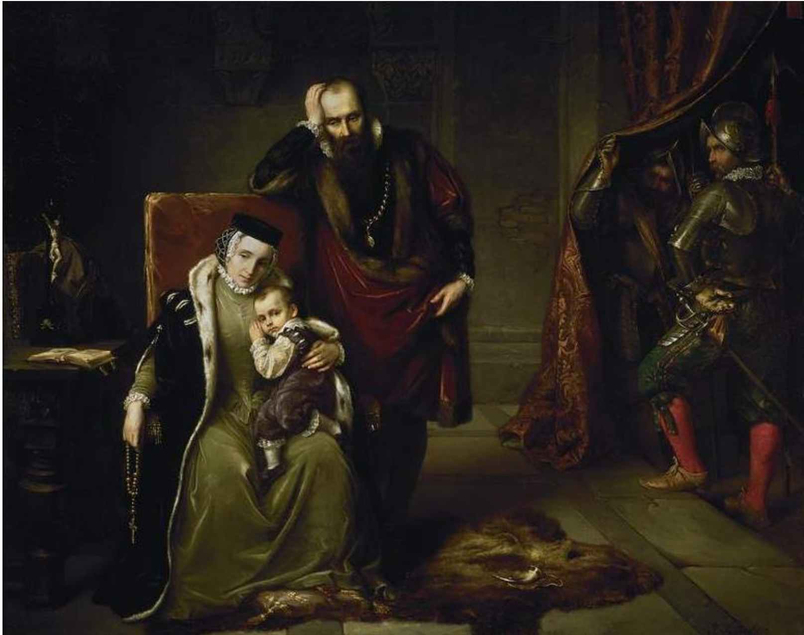
Katarzyna Jagiellonka w więzieniu na zamku Gripsholm, Józef Simmler, 1859