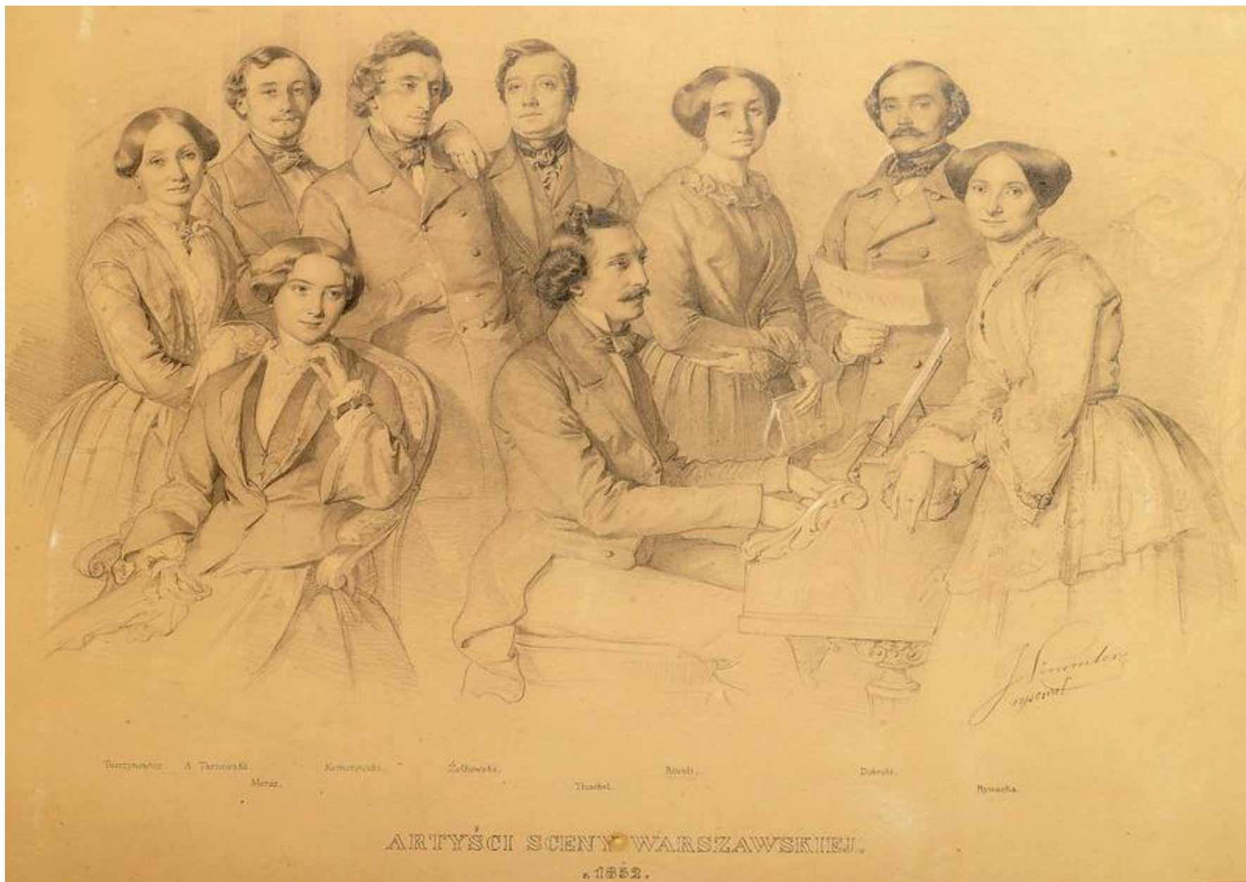
Artyści sceny warszawskiej, Józef Simmler, 1852