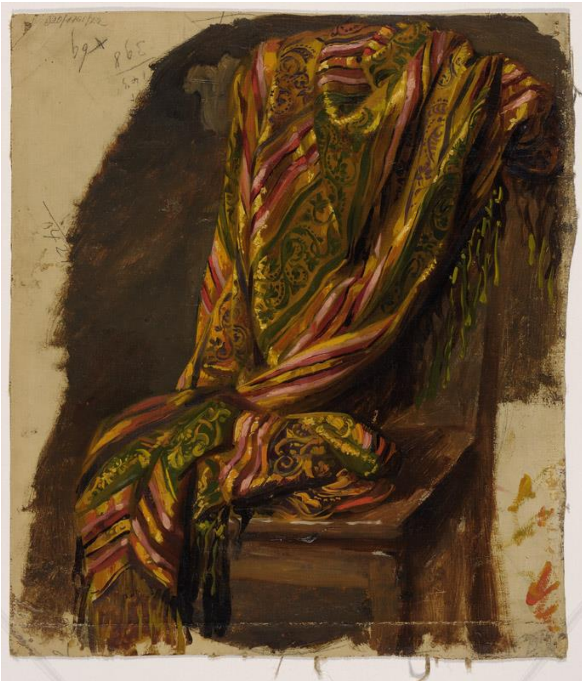
Studium draperii, Józef Simmler, po 1860