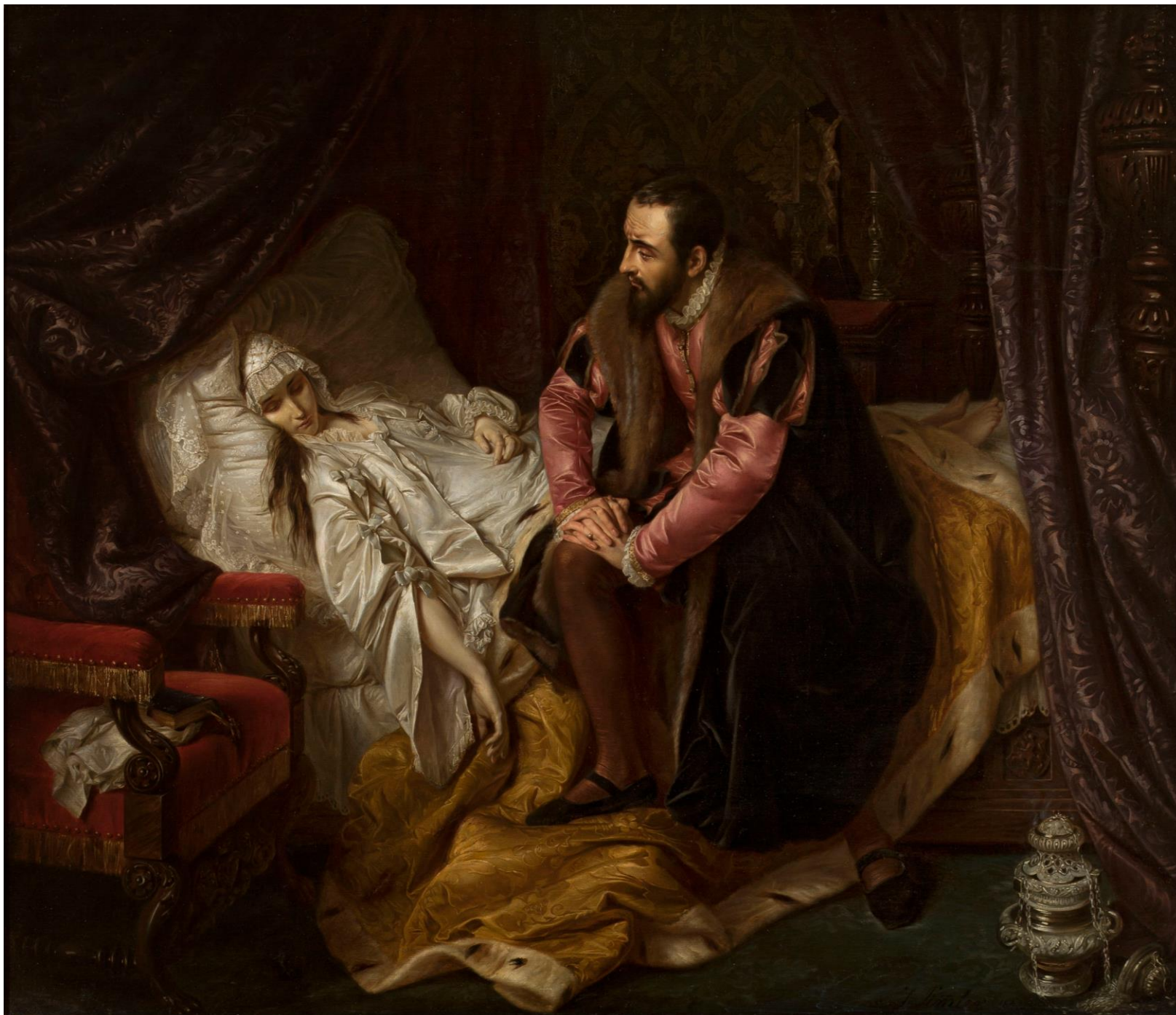
Śmierć Barbary Radziwiłłówny, Józef Simmler, ok. 1860