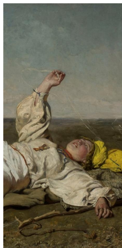
Babie Lato (fragment), Józef Chełmoński, 1875

Odpowiedzi: 1.b, 2.a/2, b/3, c/1, 3.a, 4.b, 5.a