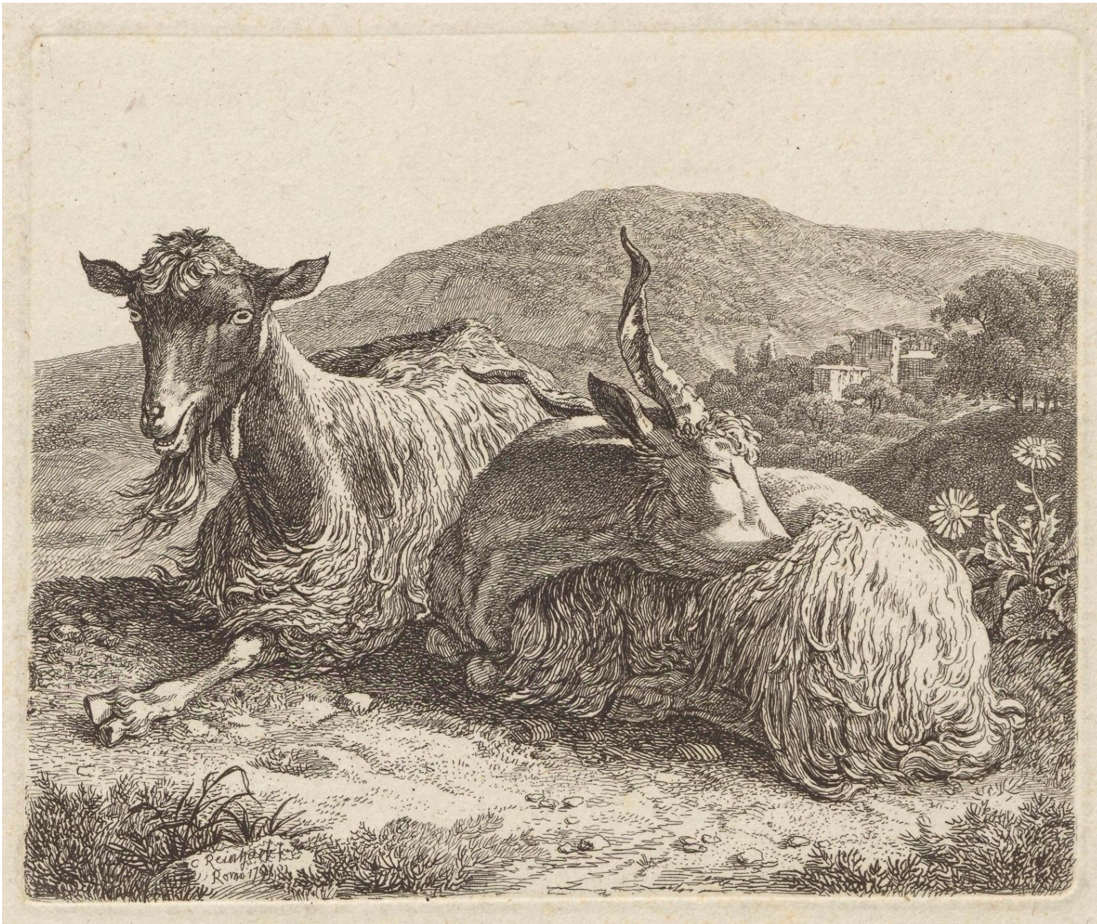
Koza i kozioł, Johann Christian Reinhart, 1798