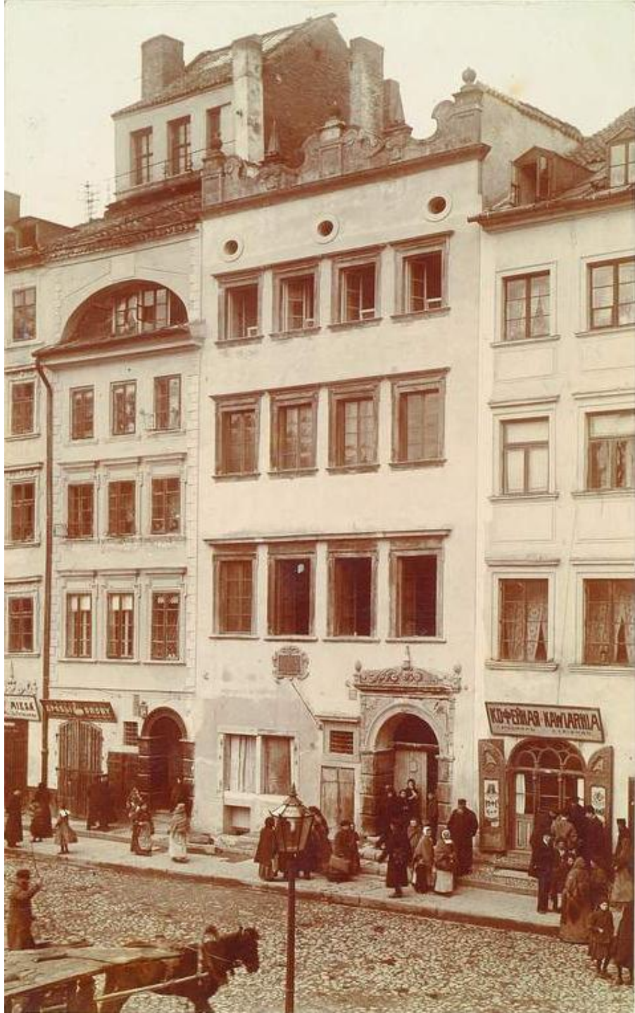
Warszawa, Rynek Starego Miasta 36-30, strona Dekerta, ok 1910