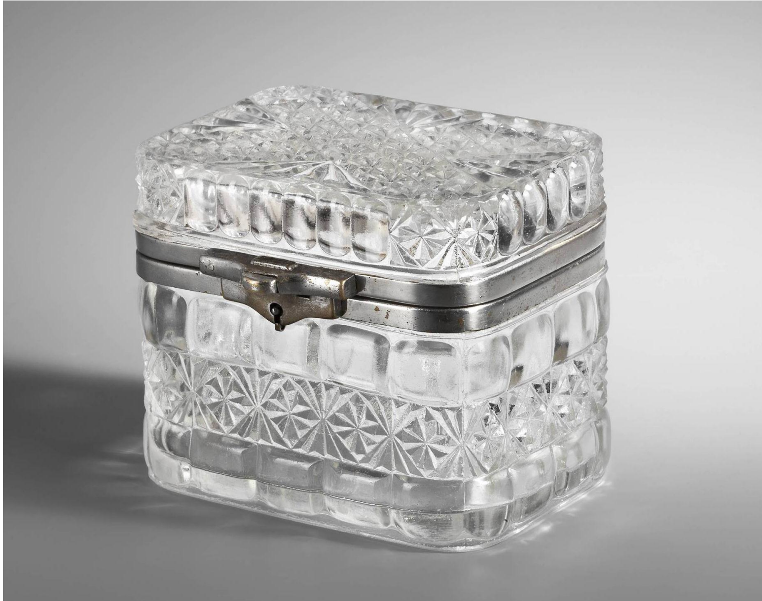
Cukiernica z nakrywką, po 1903