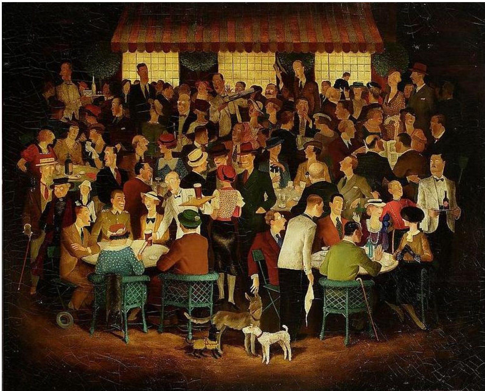
Kawiarnia, Stefan Płużański, 1934