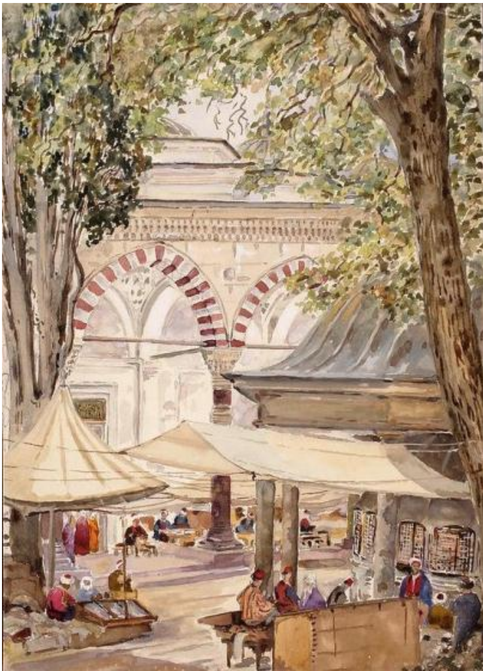
Ulica w Stambule, Cyprian Lachnicki, po 1860