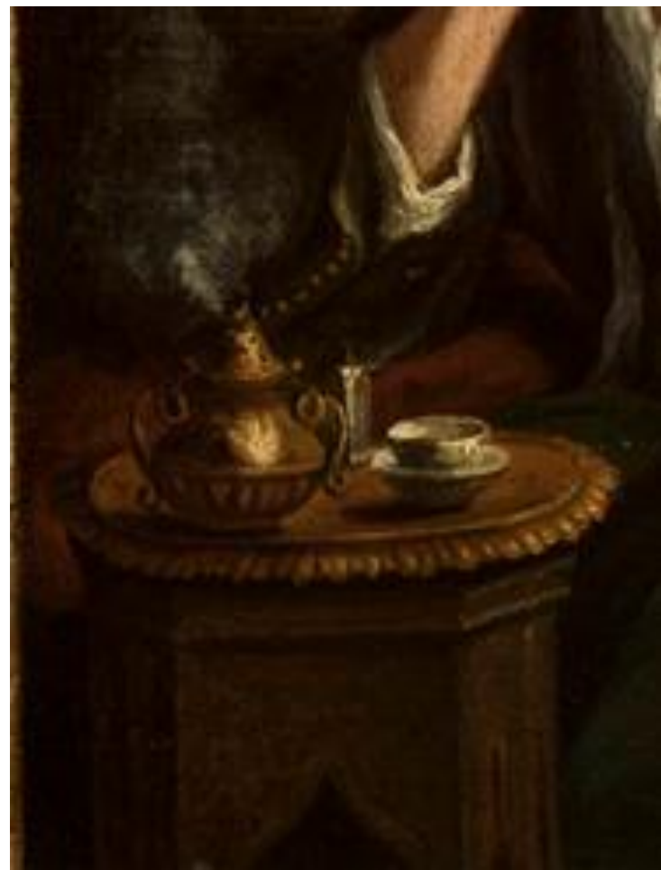
Turek przy kawie, Johann Samuel Mock, XVIII w.