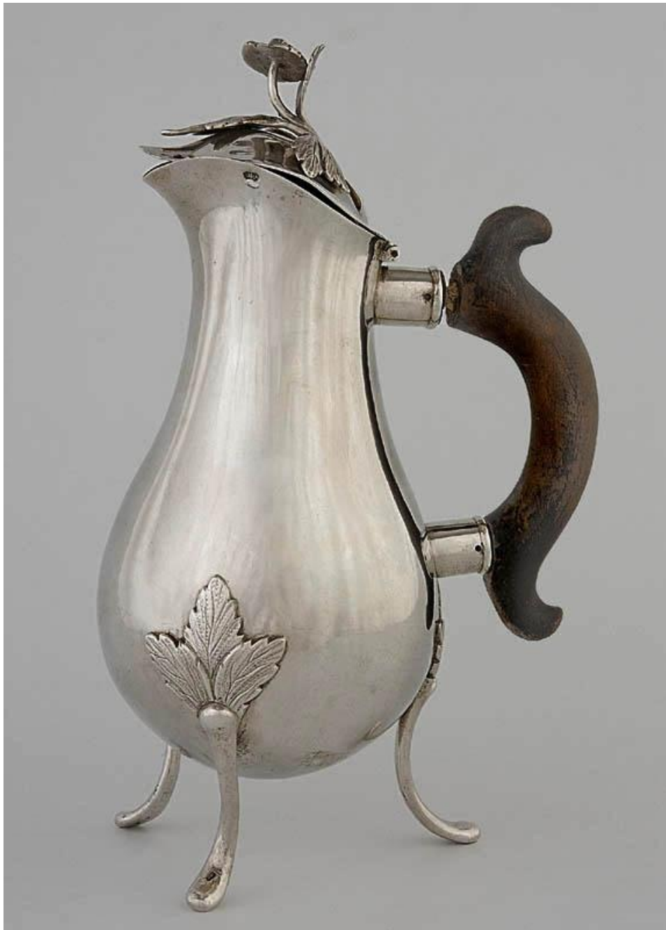
Rokokowy dzbanek do kawy, XVIII w.