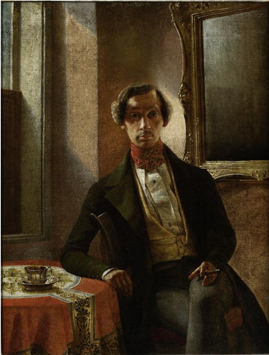
Autoportret, Marcin Zaleski, ok. 1840