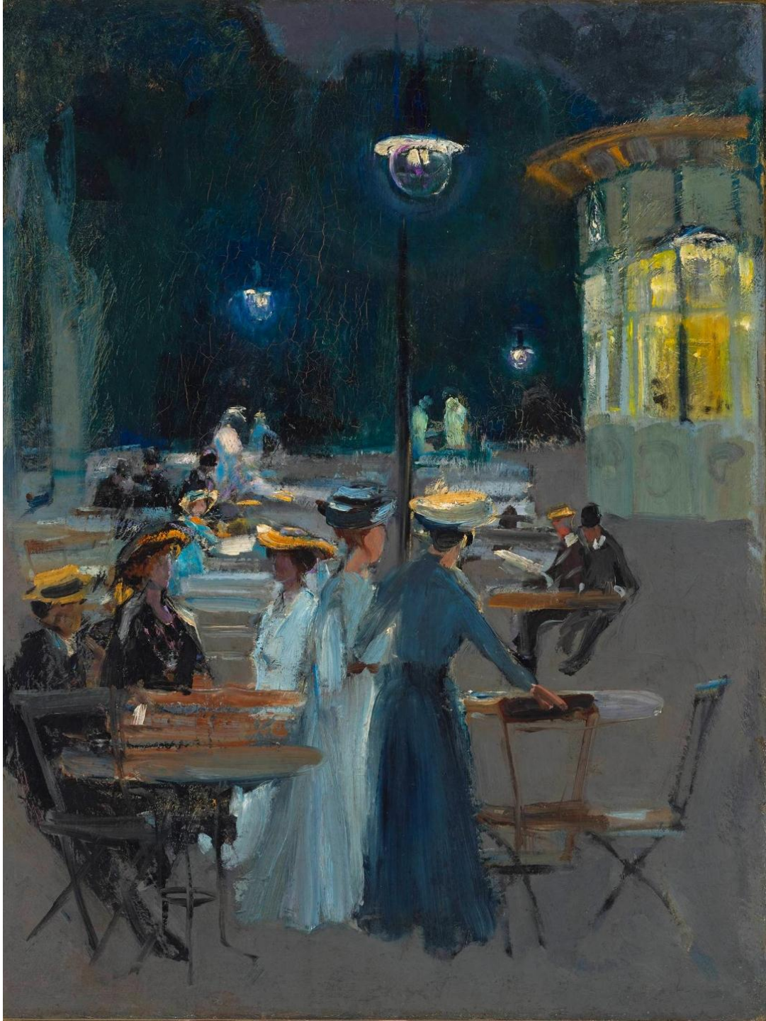
Kawiarnia paryska w nocy, Ludwik de Laveaux, po 1890