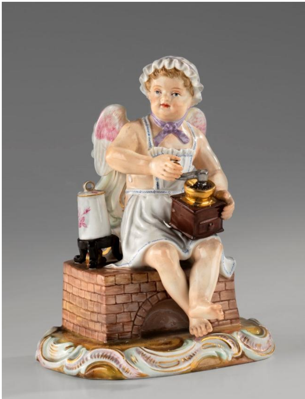
Amor z młynkiem do kawy, Miśnia, XIX/XX wiek