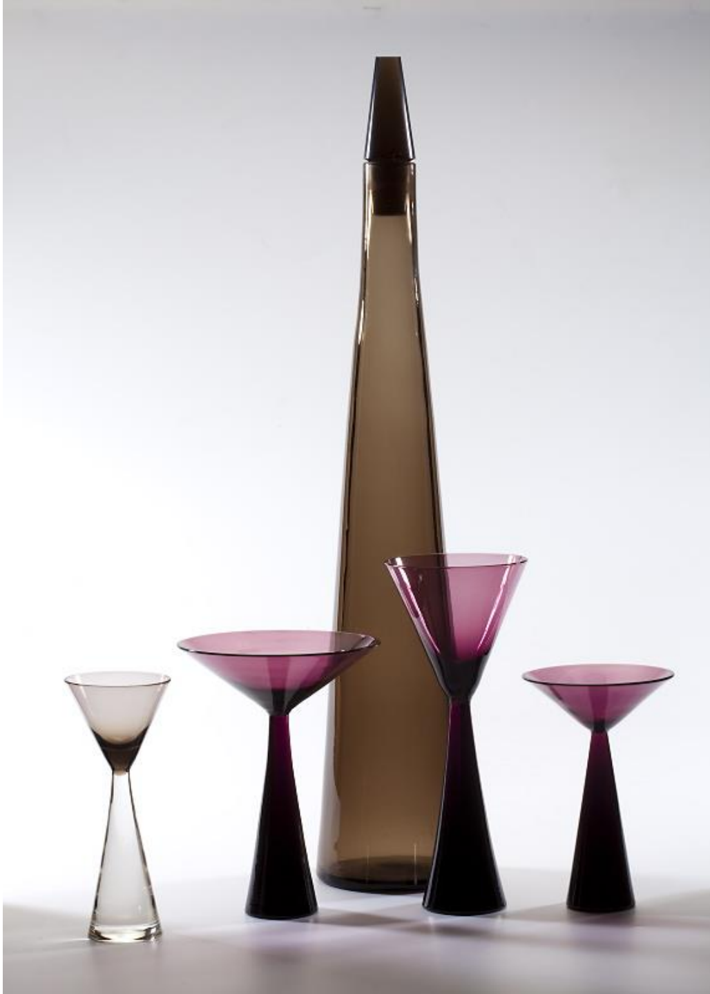
Karafka stożkowa ze szkła dymnego i kieliszki, 1960, Wiesław Sawczuk, Huta Szkła Gospodarczego “Hortensja”