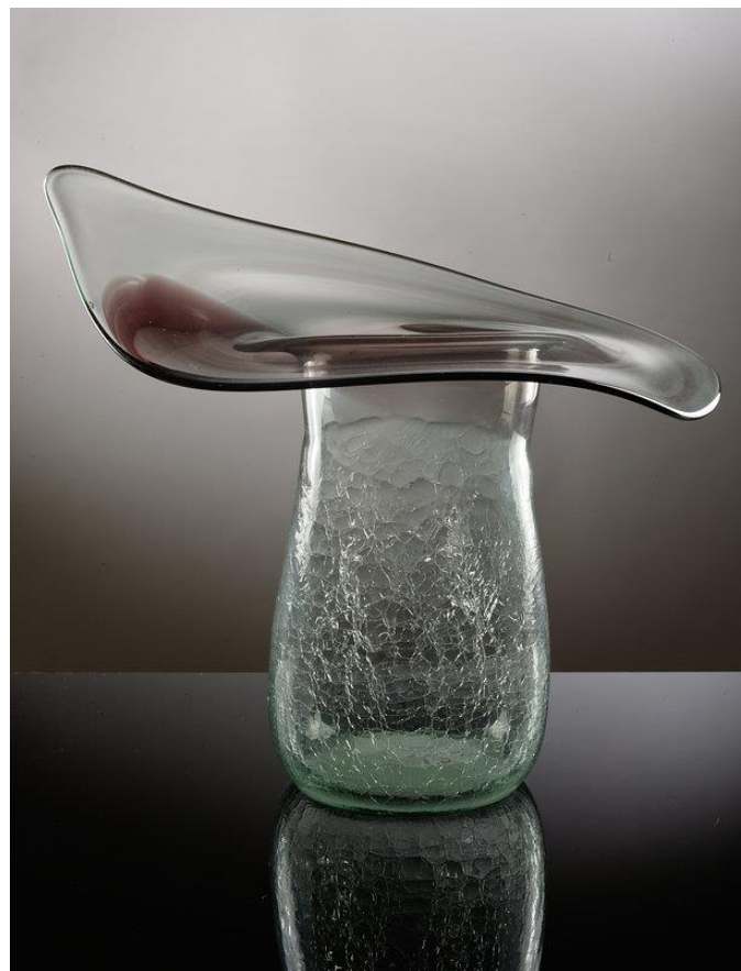
Wazon szklany z asymetrycznym kołnierzem, 1967