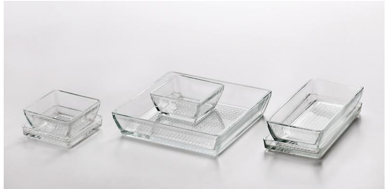
Tacka-salaterka z zestawu CONTI, 1967