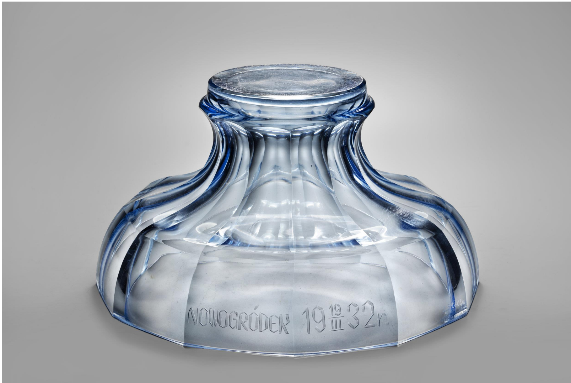
Postawa pod wazon, Huta Szkła J. Stolle, "Niemen", ok. 1932