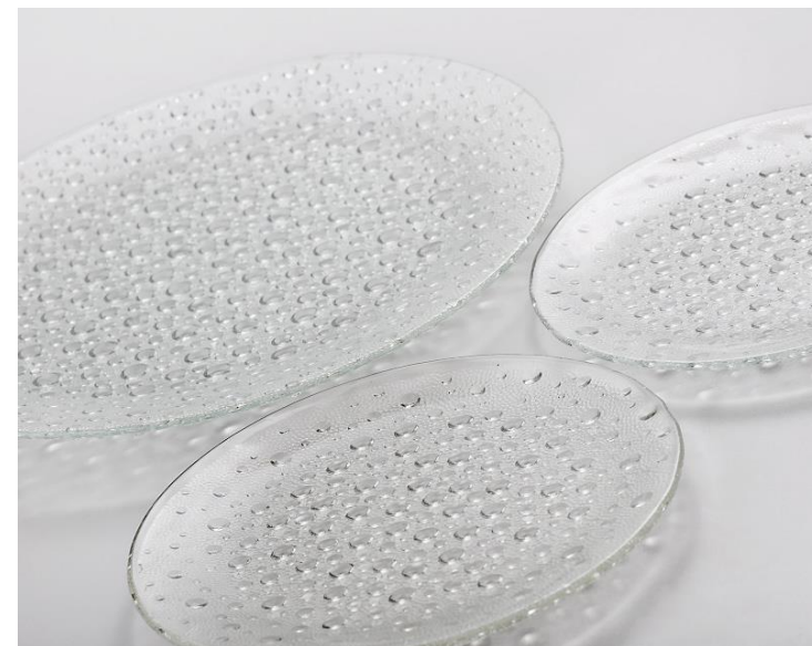
Talerze, wazon lub popielnica z zestawu ASTEROID, Jan Sylwester Drost 1972, Huta Szkła Żabkowice