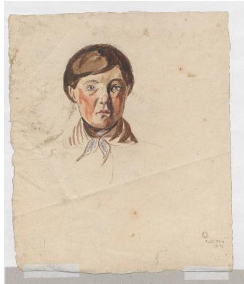
Chłopiec siedzący na krześle; verso: głowa chłopca, Piotr Michałowski, po 1820