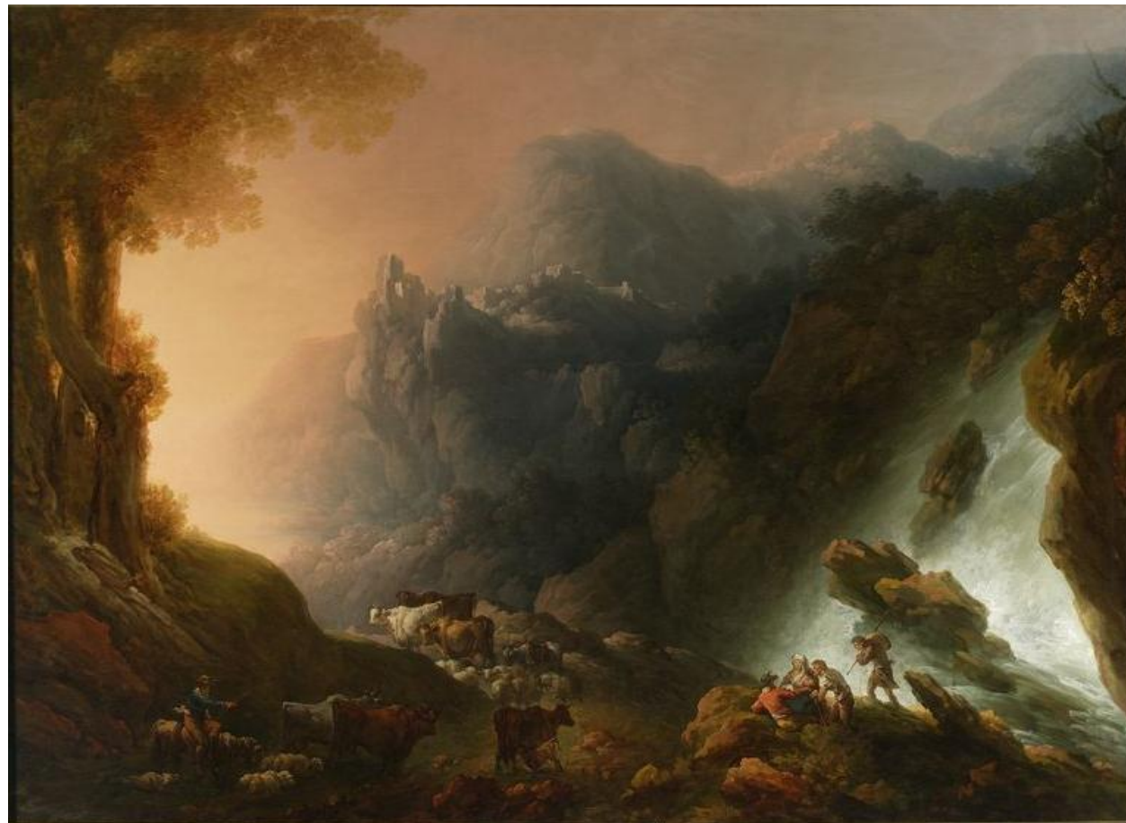
Portret Ksawerego Potockiego, 1826, Krajobraz górski z wodospadem, ok. 1820, Franciszek Ksawery Lampi