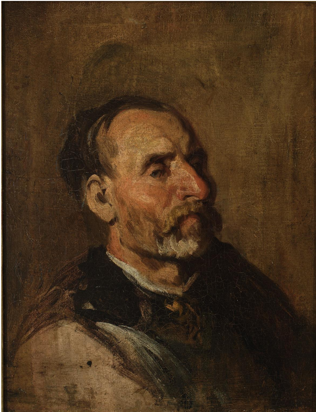
Dziadek wiejski, Piotr Michałowski, po 1840