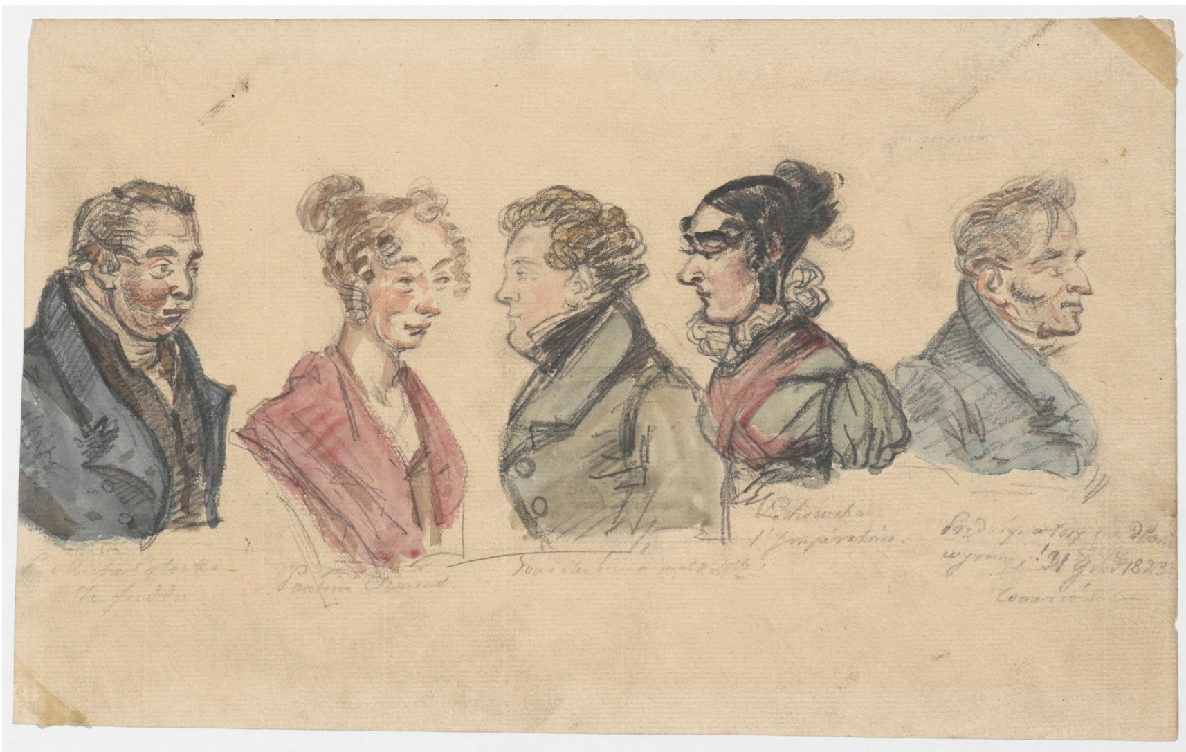
Karykatury gości hr. Antoniego Ostrowskiego w Tomaszowie, Piotr Michałowski, 1823