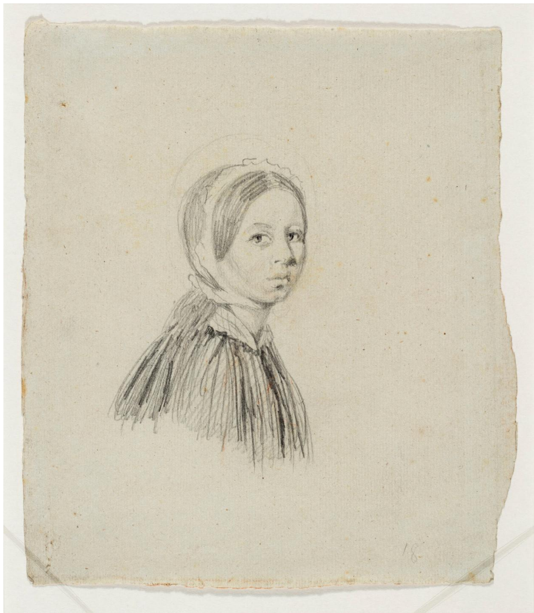
Portret żony w czepku, Piotr Michałowski, po 1831