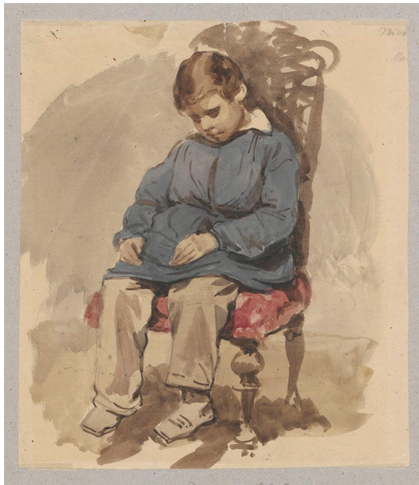
Studium chłopca śpiącego w fotelu - model w pracowni Charleta