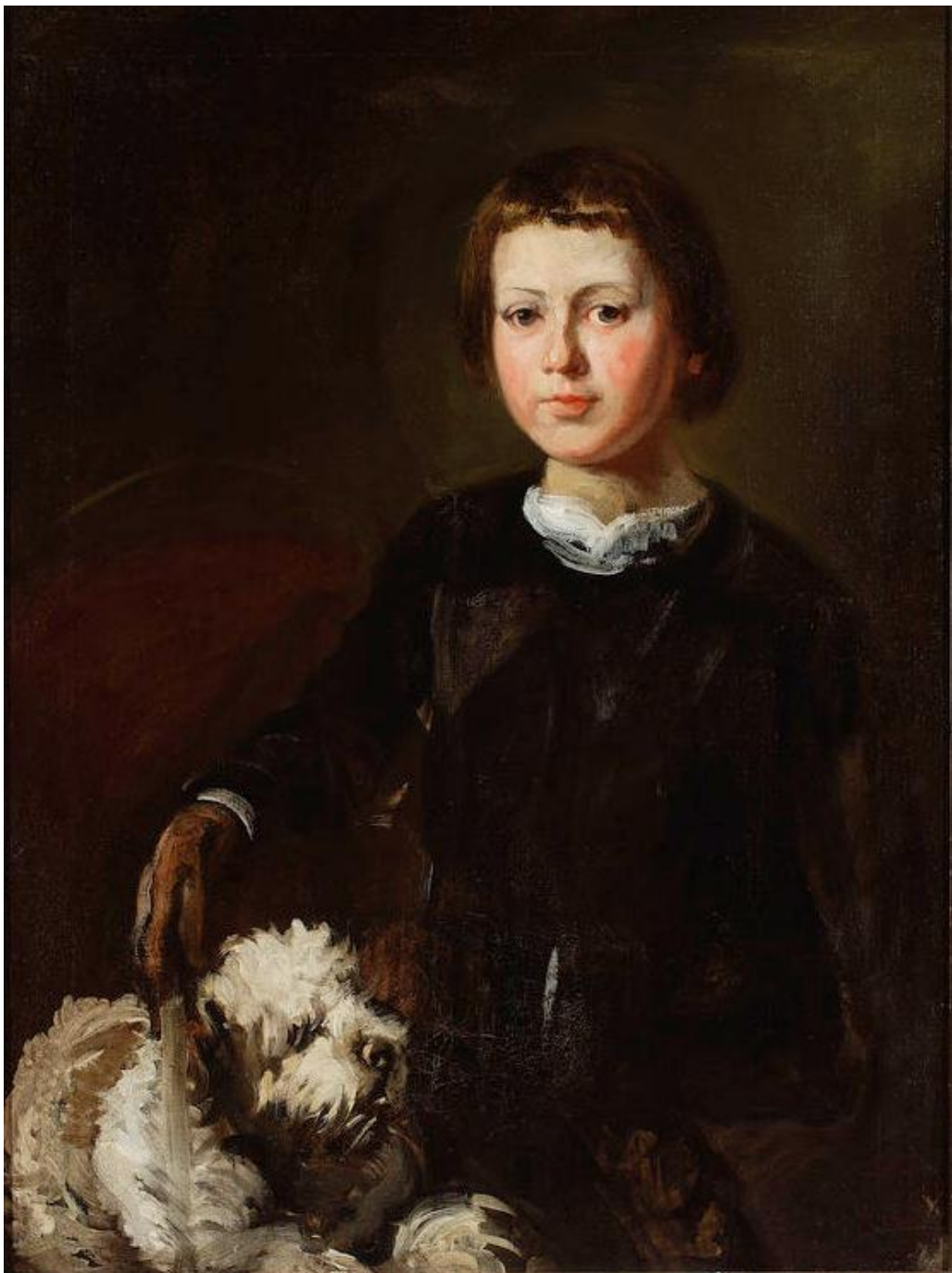
Portret syna artysty z psem, Piotr Michałowski, ok. 1841