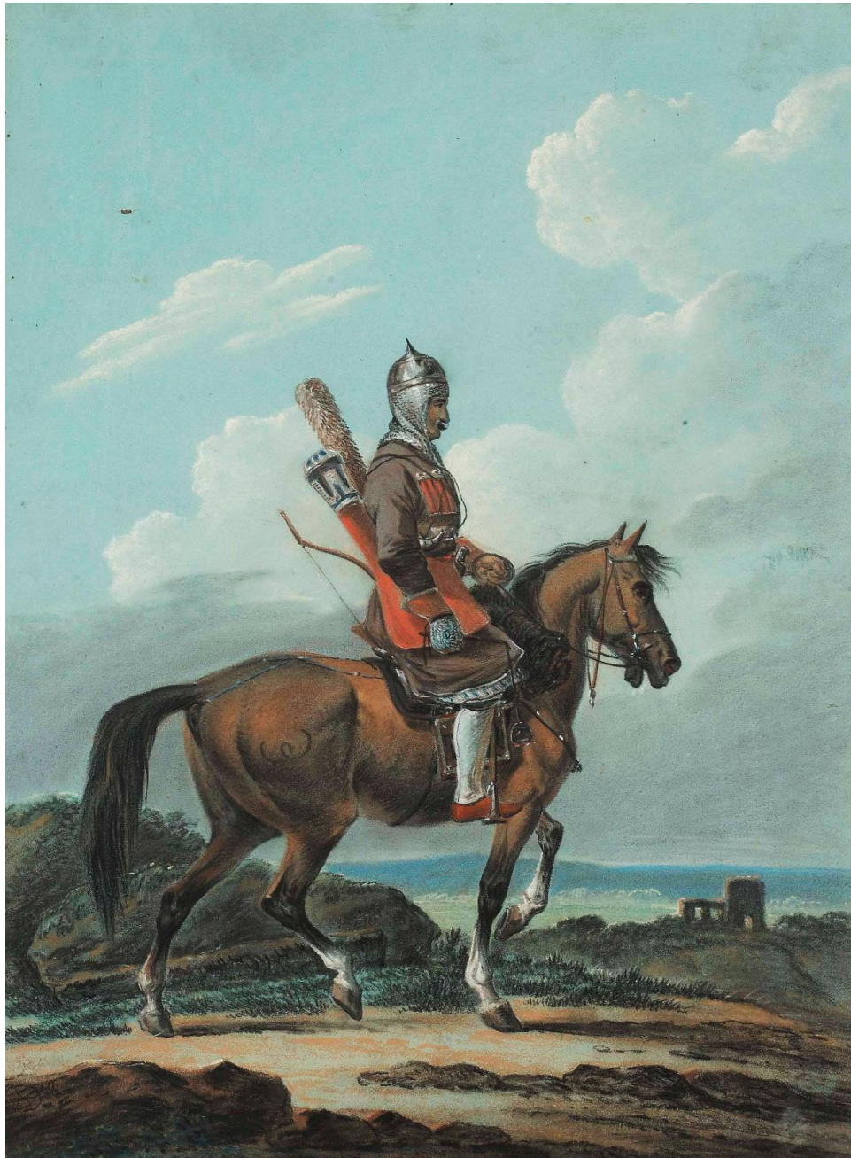
Jeździec pancerny kaukaski, Aleksander Orłowski, 1810