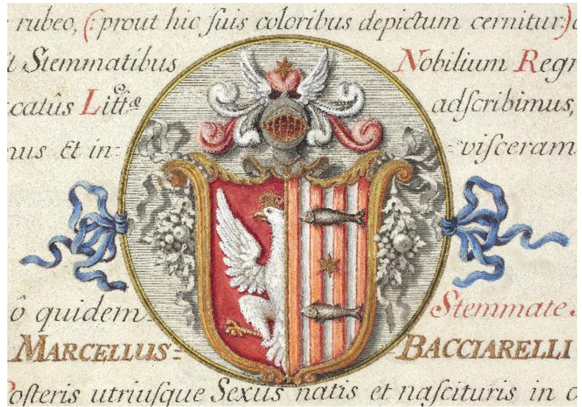
Dyplom szlachectwa Marcello Bacciarellego, 29 października 1771