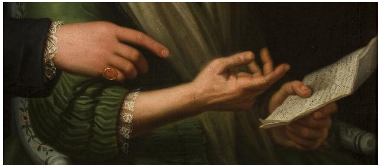
Portret matki i brata Marcelego Bacciarellego, Marcello Bacciarelli (?), 2. poł. XVIII w.

Najdroższa matko (...), i proszę powiedzieć mojemu bratu, że nigdy nie zapomnę odwzajemnić jego przysług, a na koniec, prosząc o wasze błogostawieństwo, piszę się waszym najprzywiązańszym synem.