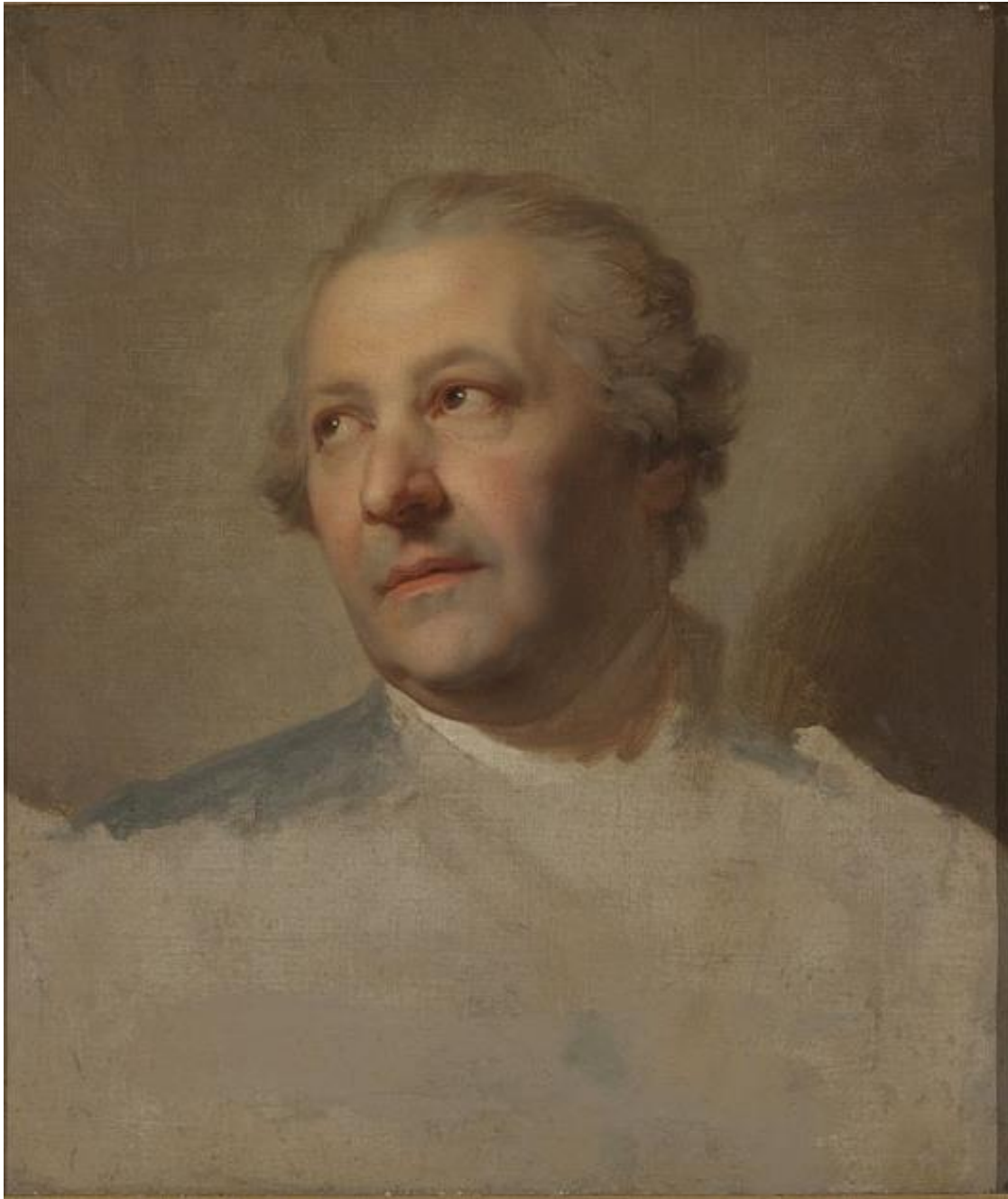
Portret Ismaela Mengsa, Marcello Bacciarelli, studium, 1755-60