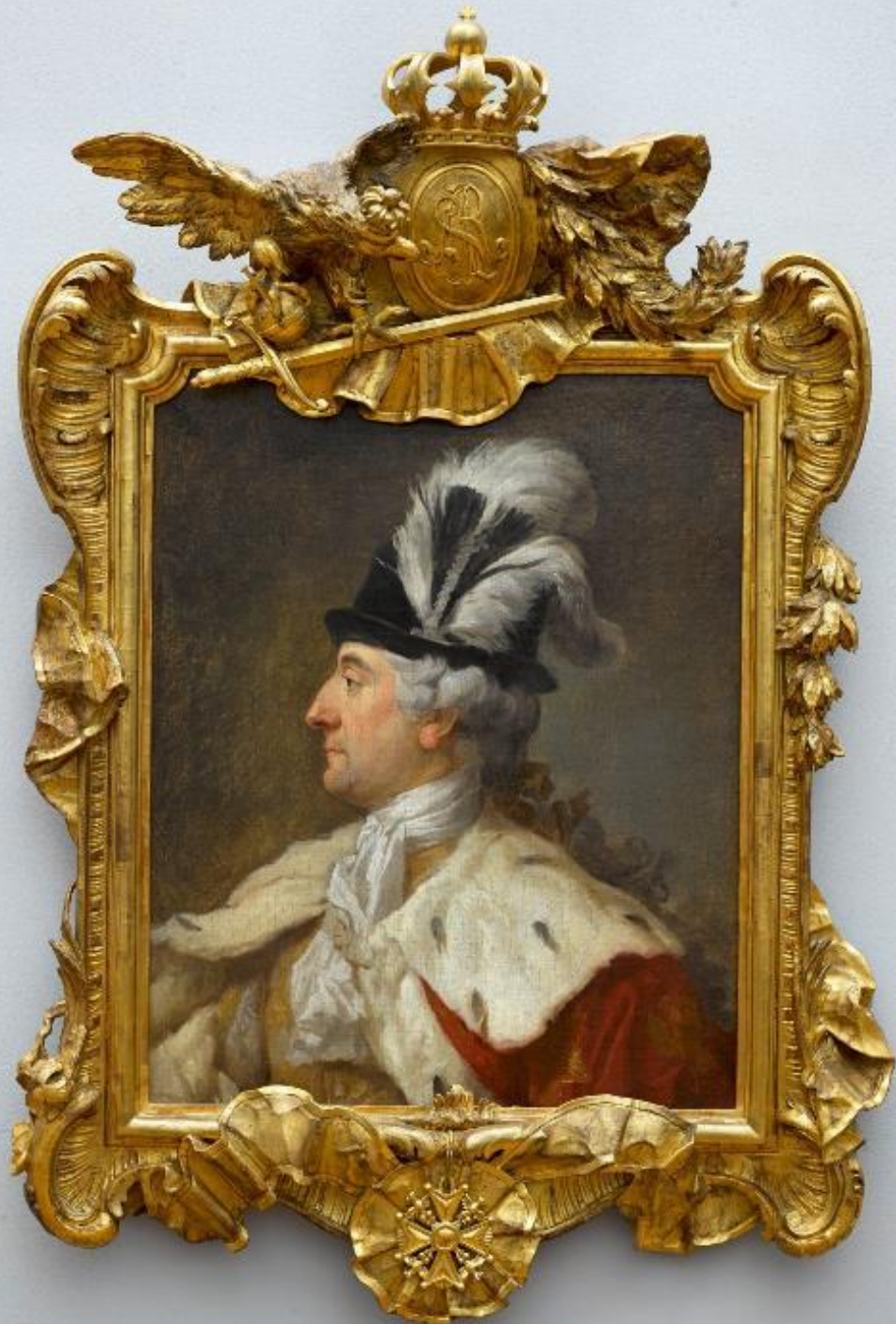
Portret Stanisława Augusta w kapeluszu z piórami, Marcello Bacciarelli, ok. 1785