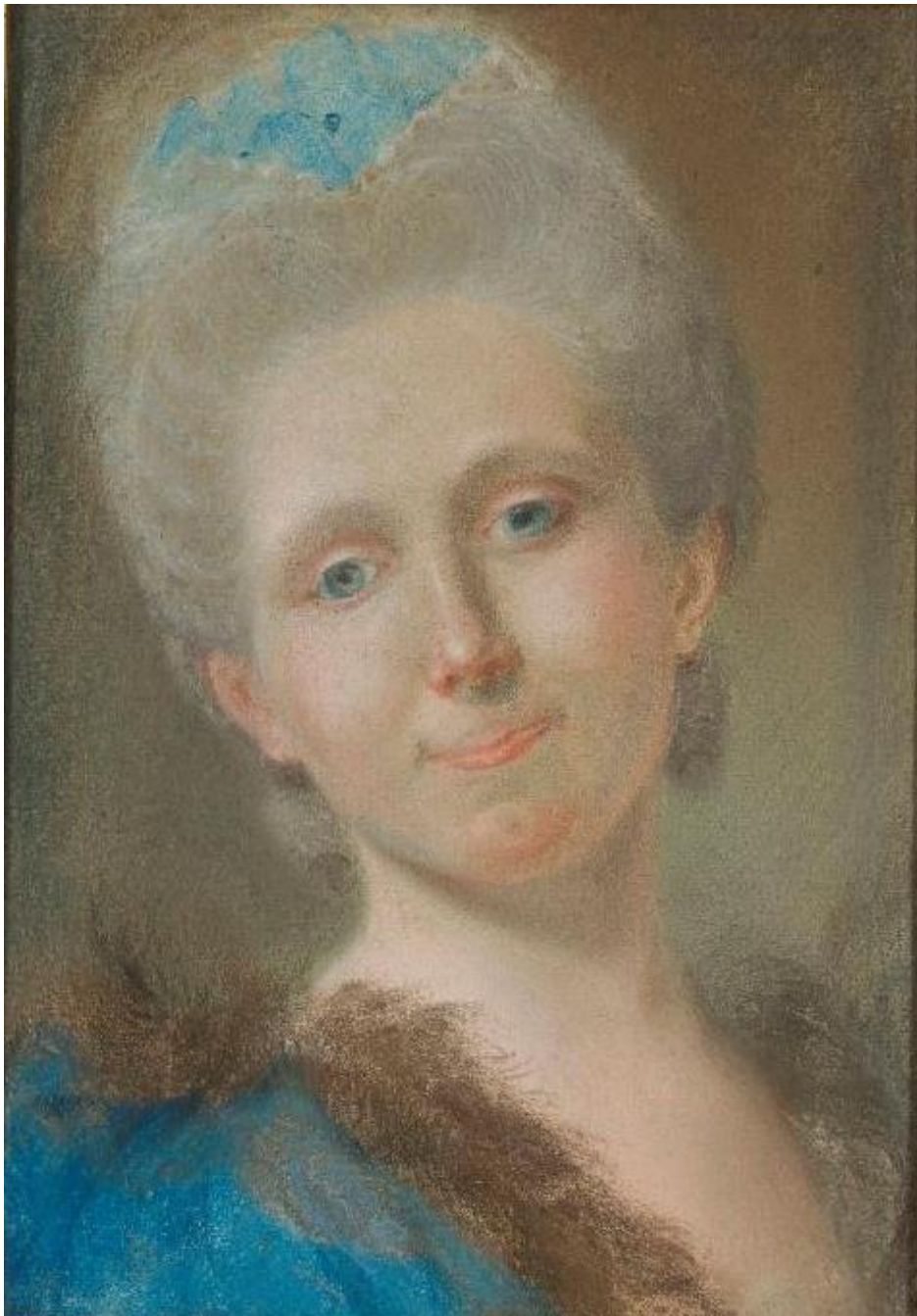
Portret Johanny Juliany Fryderyki z Richterów Bacciarelli, Marcello Bacciarelli poł. XVIII w.