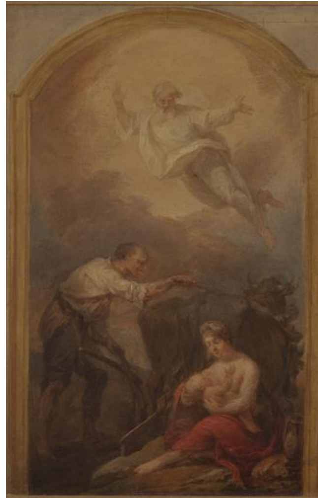
Święty Izydor orzący rolę, Marcello Bacciarelli, szkic, ok. 1805