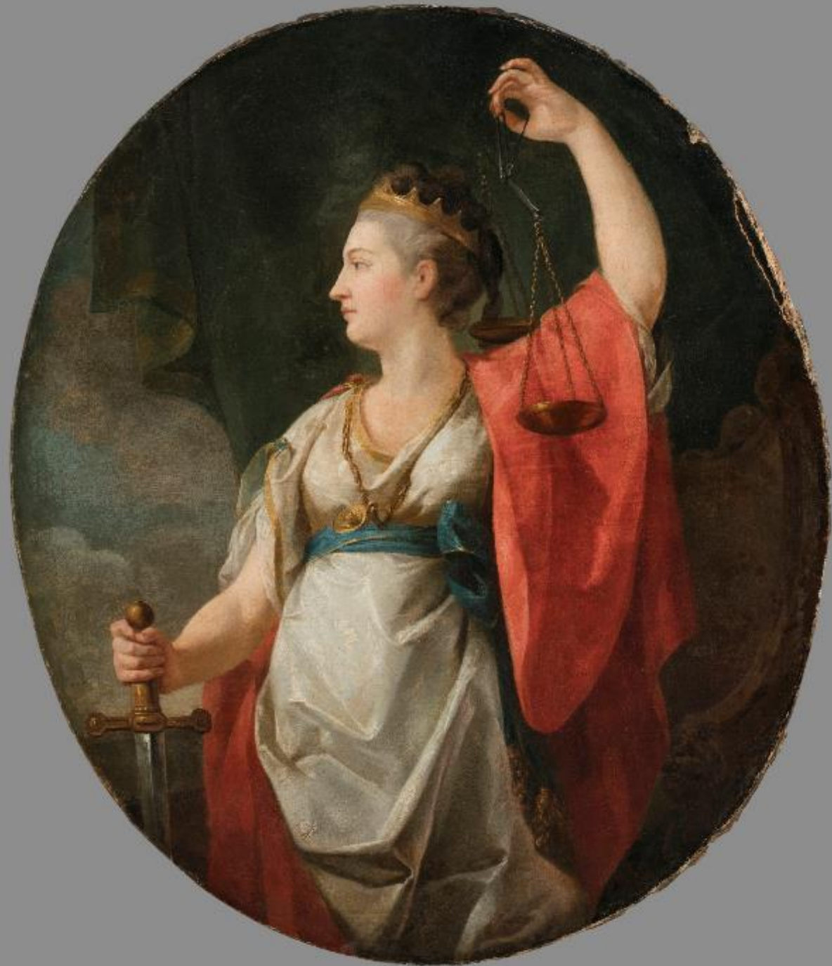
Alegoria Sprawiedliwości - Temida, Marcello Bacciarelli, ok. 1800