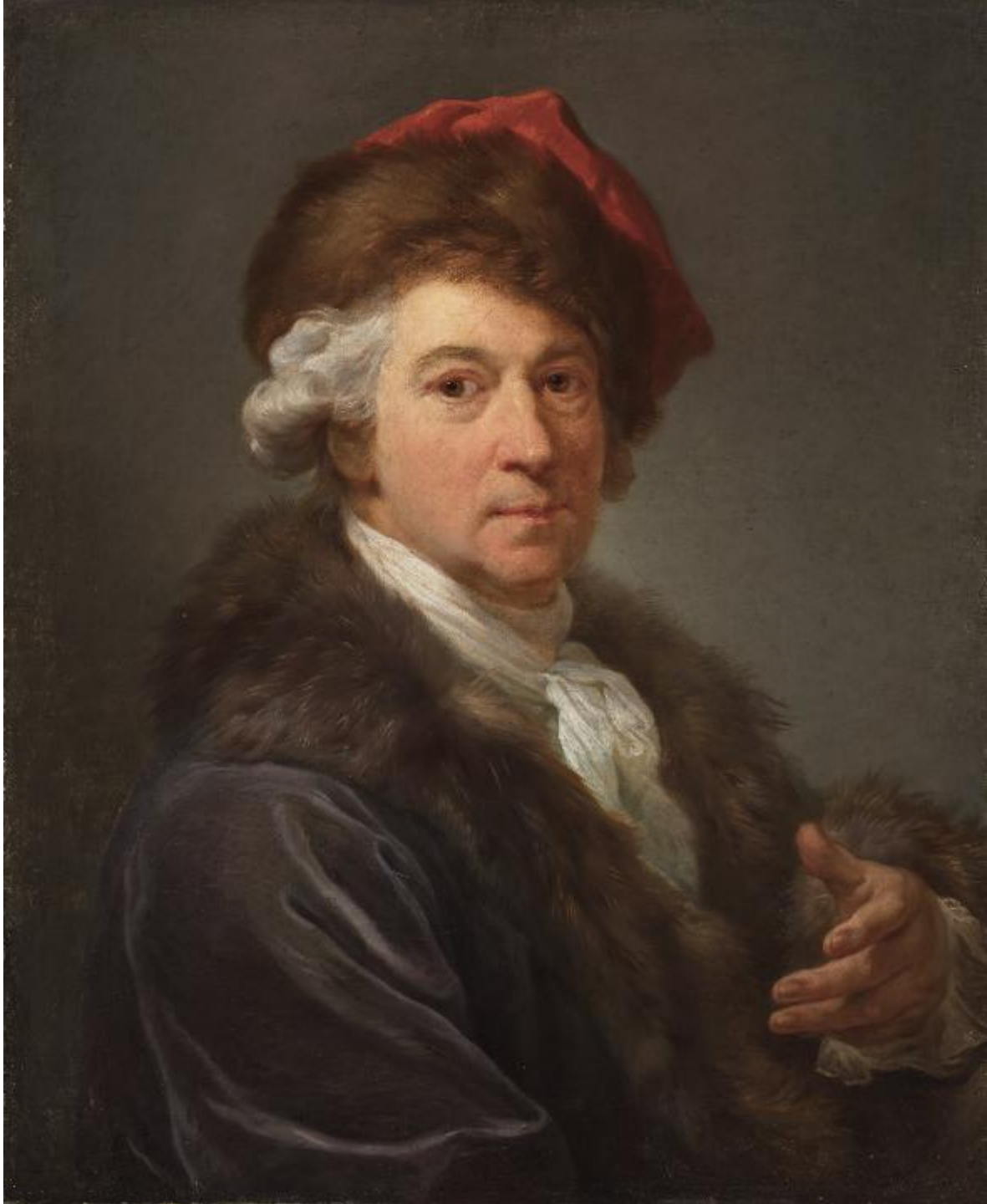
Autoportret w konfederatce, Marcello Bacciarelli, ok. 1793