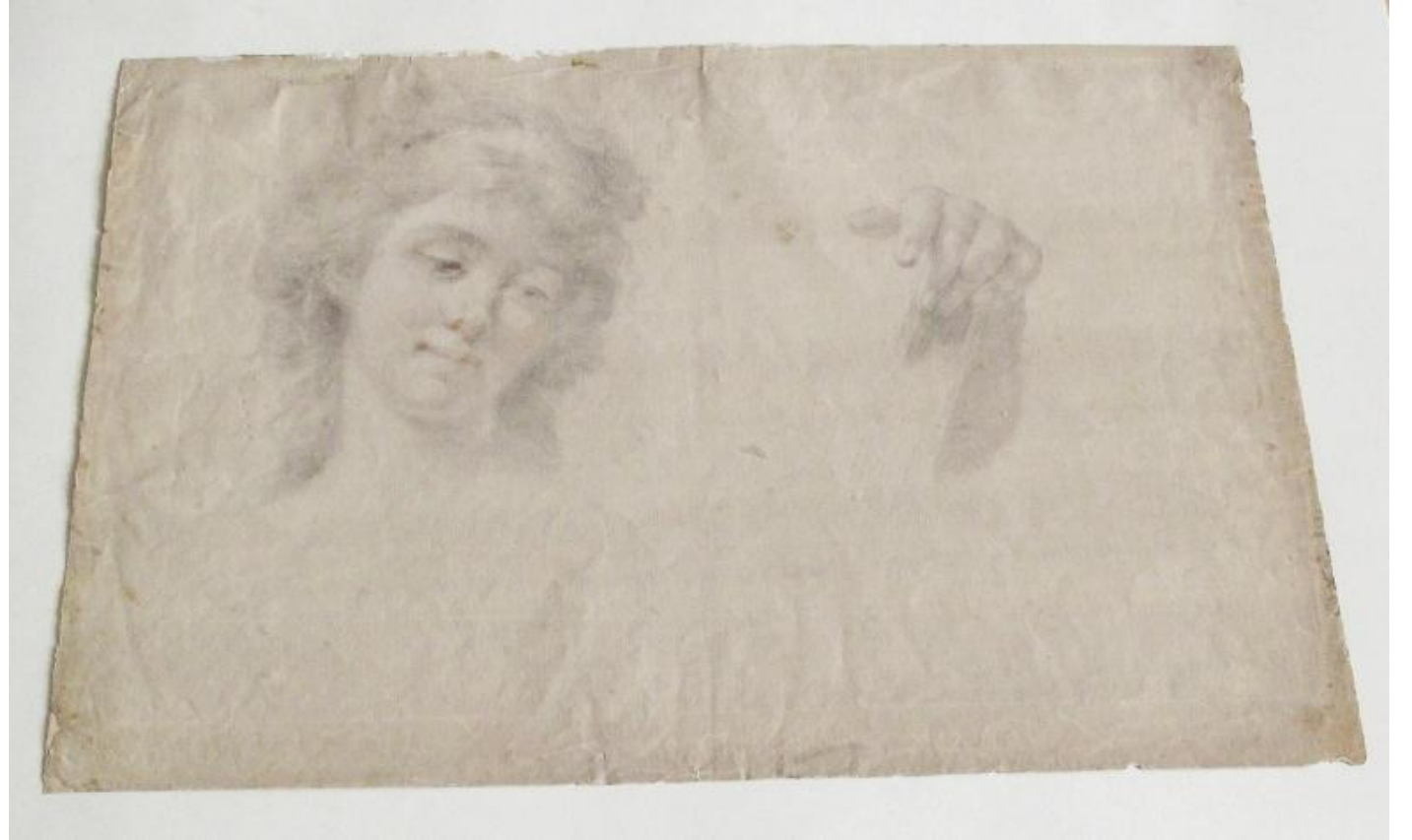
Rysunki, Marcello Bacciarelli