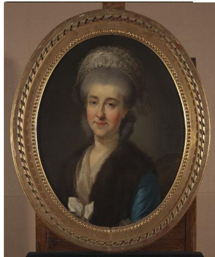
Portret Ludwiki z Poniatowskich Zamoyskiej, siostry króla, Marcello Bacciarelli (kraj), ok. 1775