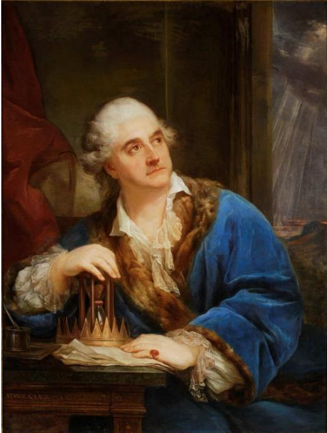
Portret Stanisława Augusta z klepsydrą, Marcello Bacciarelli, 1793