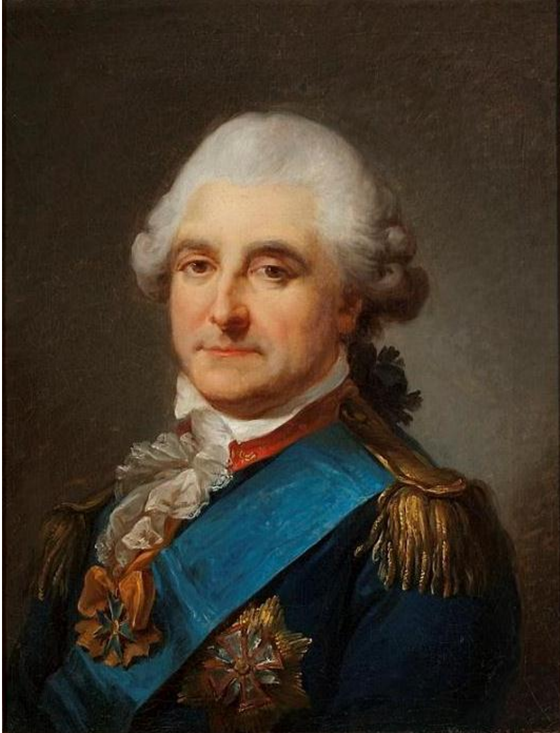
Portret Stanisława Augusta Poniatowskiego, Marcello Bacciarelli, ok. 1785