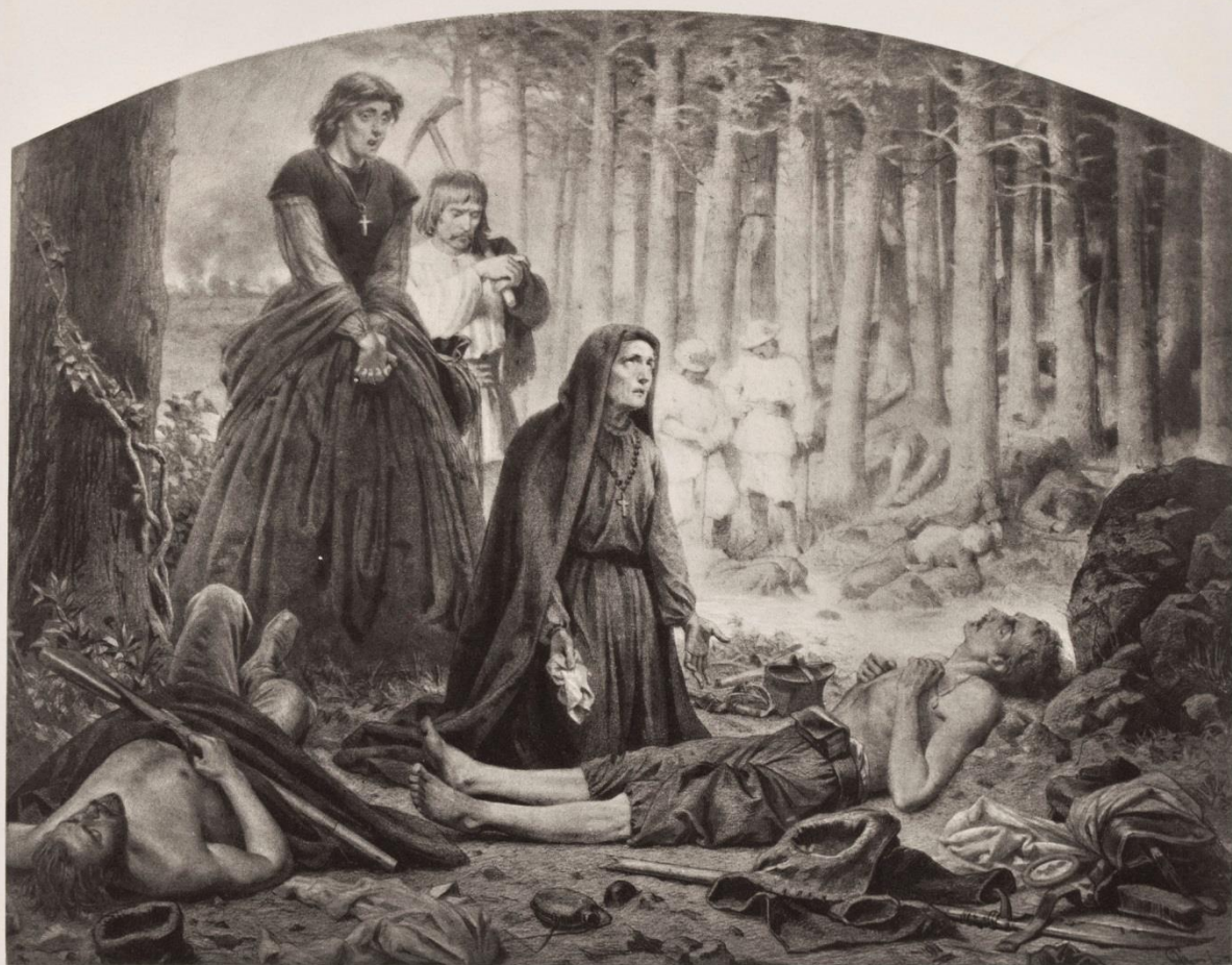
W lesie po bitwie. — Après la bataille.

W lesie po bitwie Plansza 8 z cyklu Polonia , 1888 (1863), heliograwiura