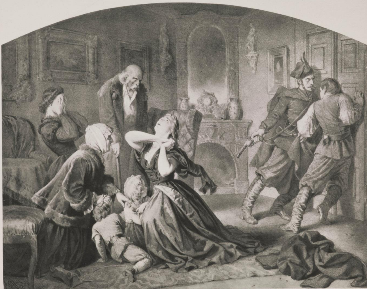
Obrona dworu. — La defense des assieges.

Obrona dworu, plansza 6 z cyklu Polonia, 1888 (1863), heliograwiura