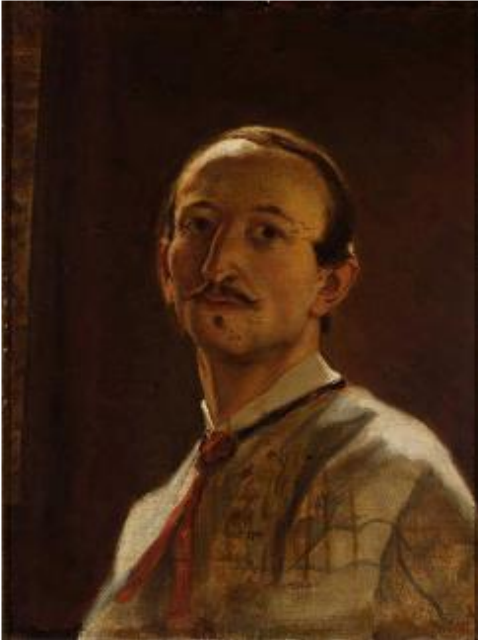
Autoportret, Artur Grottger, 1867