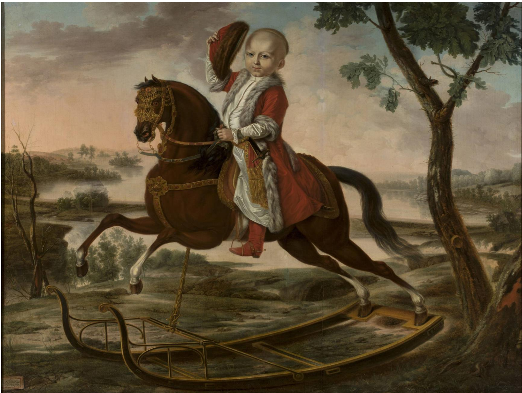
Portret Stanisława Seweryna Potockiego na koniu na biegunach, A. Lépine, 1788