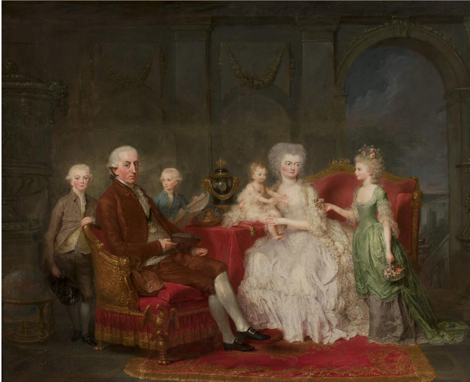
Portret rodzinny, Anna Dorothea Therbusch-Lisiewska, XVIII wiek