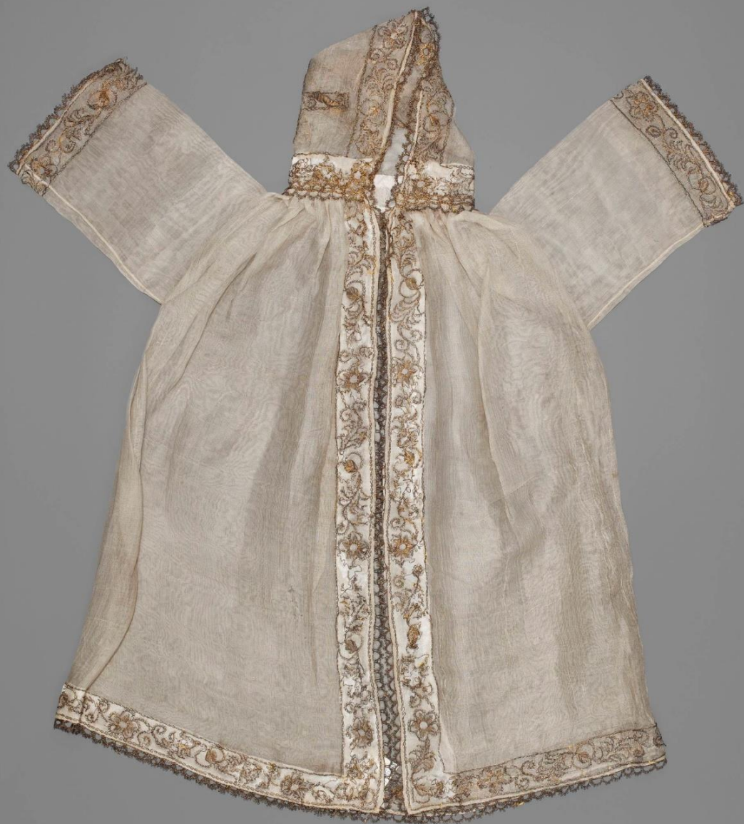
Kaftanik niemowlęcy, 1765