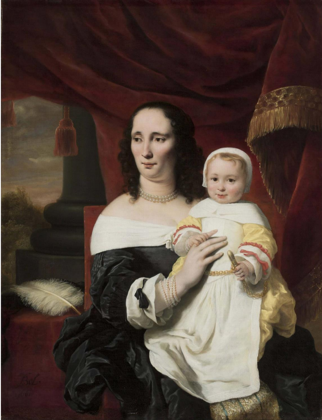
Portret Johanny de Geer-Trip z córką Cecylią, Ferdinand Bol, 1661