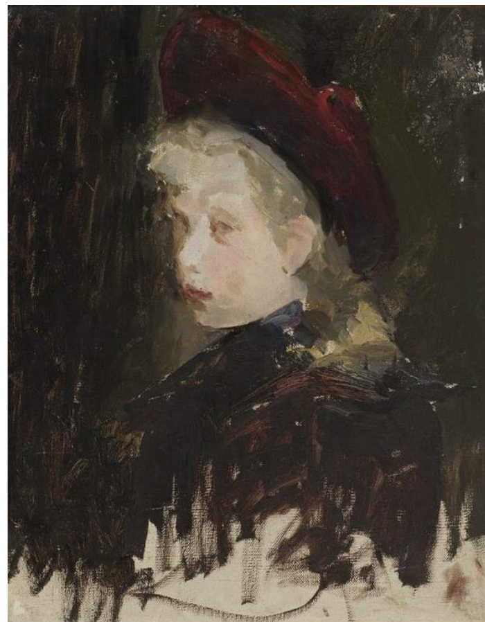
Głowa dziewczynki , J. Ciągliński, po 1900