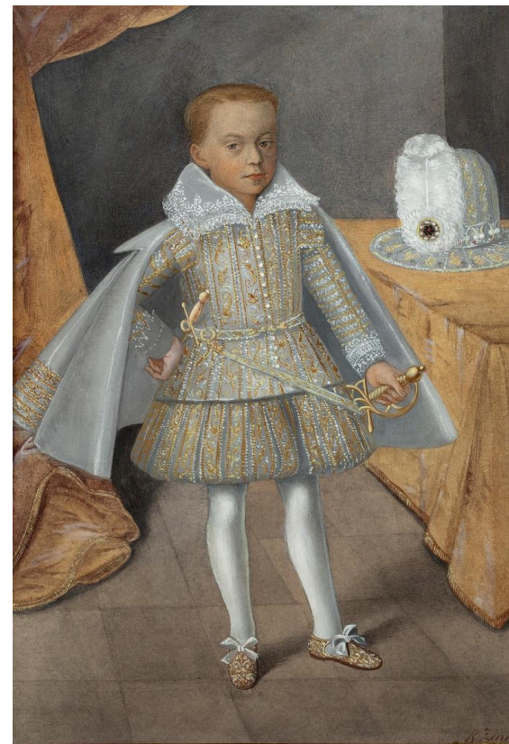
Portret Aleksandra Karola Wazy jako dziecka, według portretu z 1619 roku ze zbiorów Germanische Nationalmuseum w Norymberdze