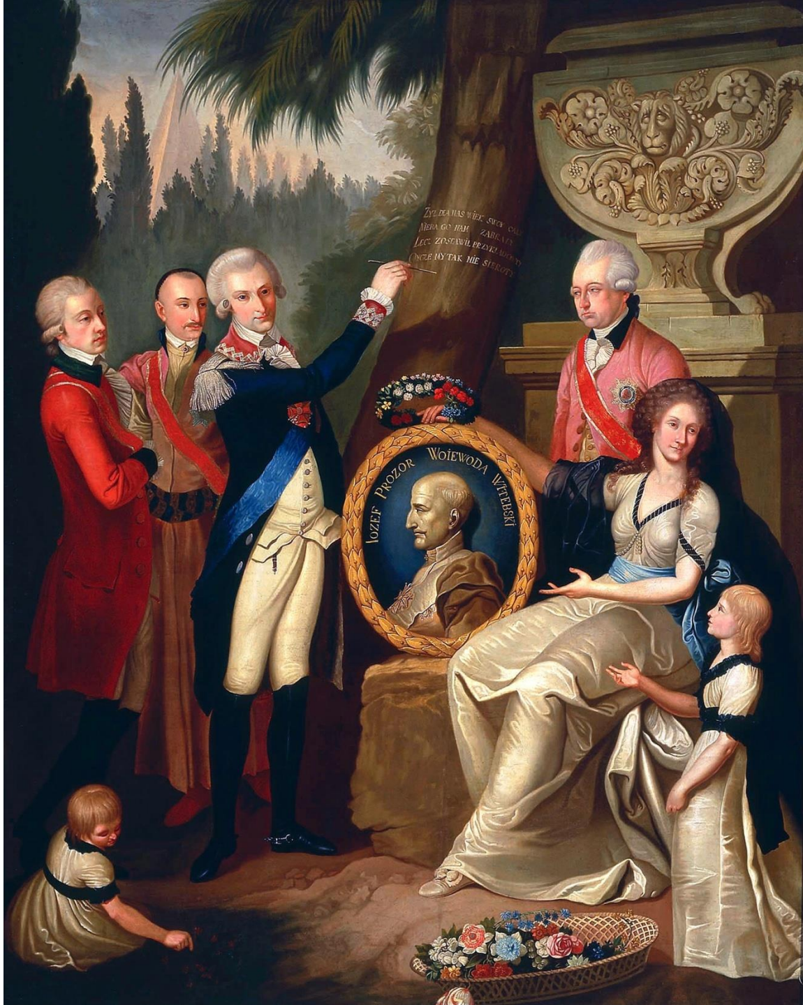
Portret rodziny Prozorów, Franciszek Smuglewicz, 1789