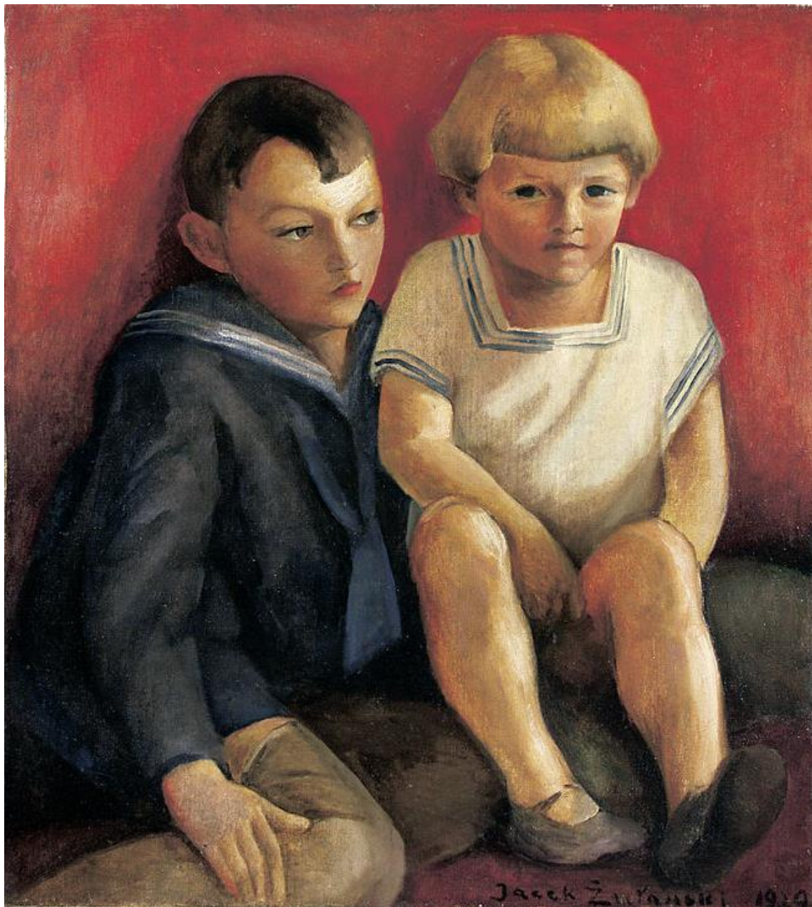
Portret dwojga dzieci, J. Żuławski, 1938