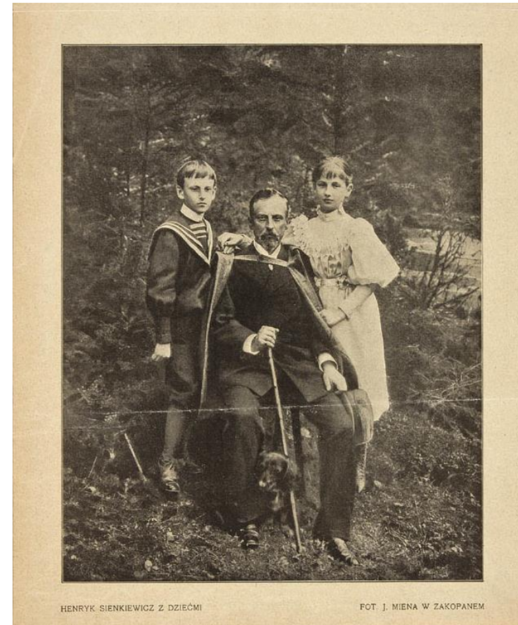
Henryk Sienkiewicz z dziećmi w Zakopanym, 1897