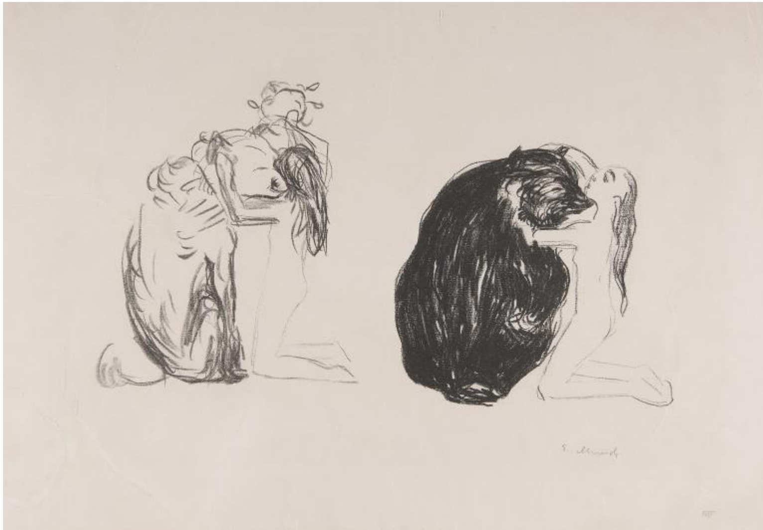
Omega spotyka niedźwiedzia, Edvard Munch, 1909, litografia