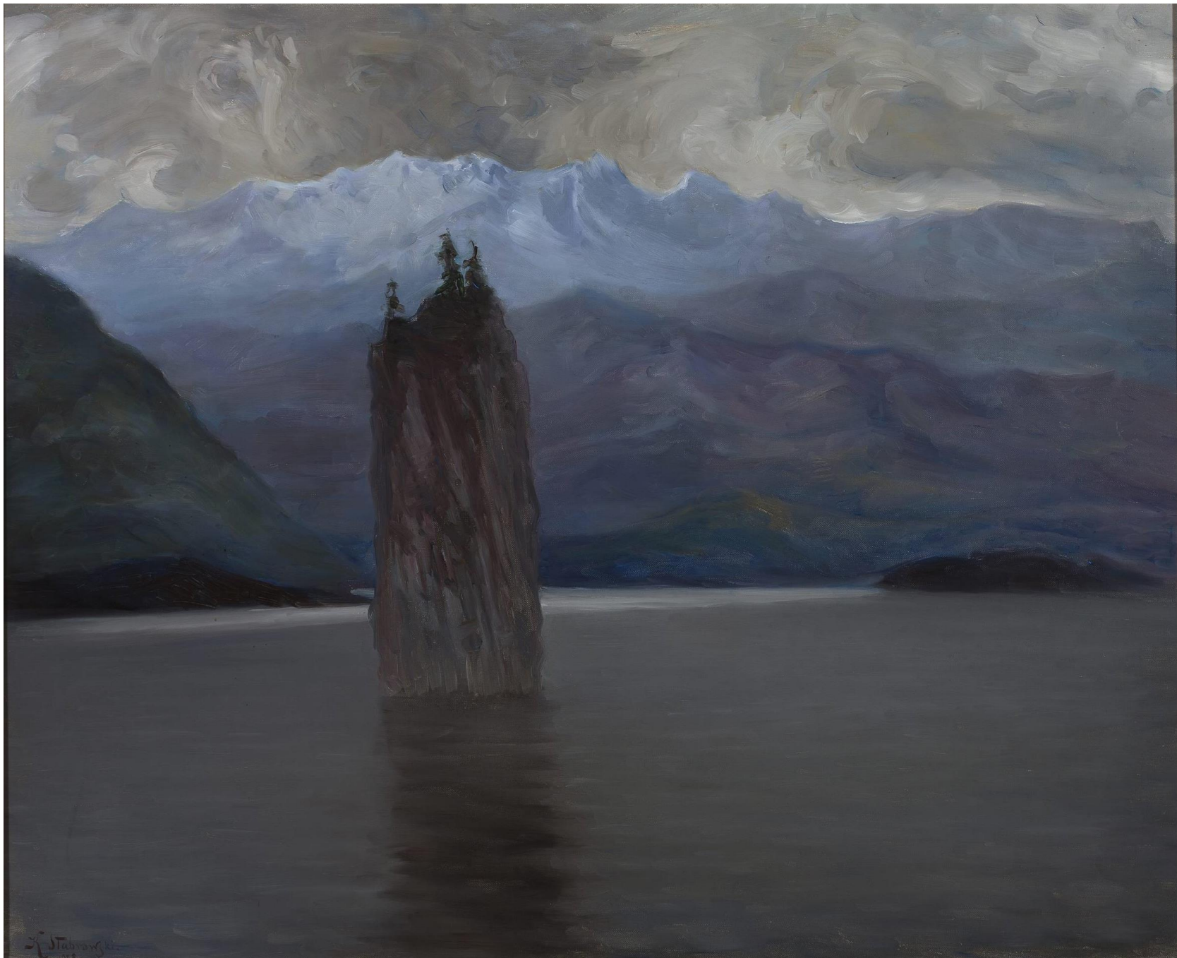
Fiord norweski, Kazimierz Stabrowski, 1928