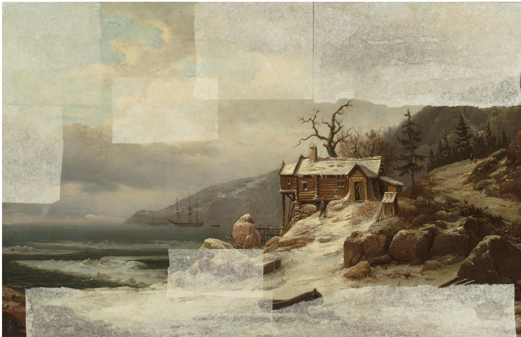
Krajobraz zimowy z Norwegii (widok Sognefjord), Chrystian Breslauer, ok. 1836–1839