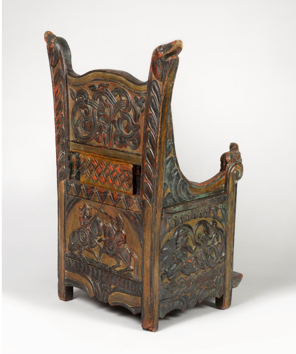
fotel, ok.1500 lub 1. poł. XVI w.