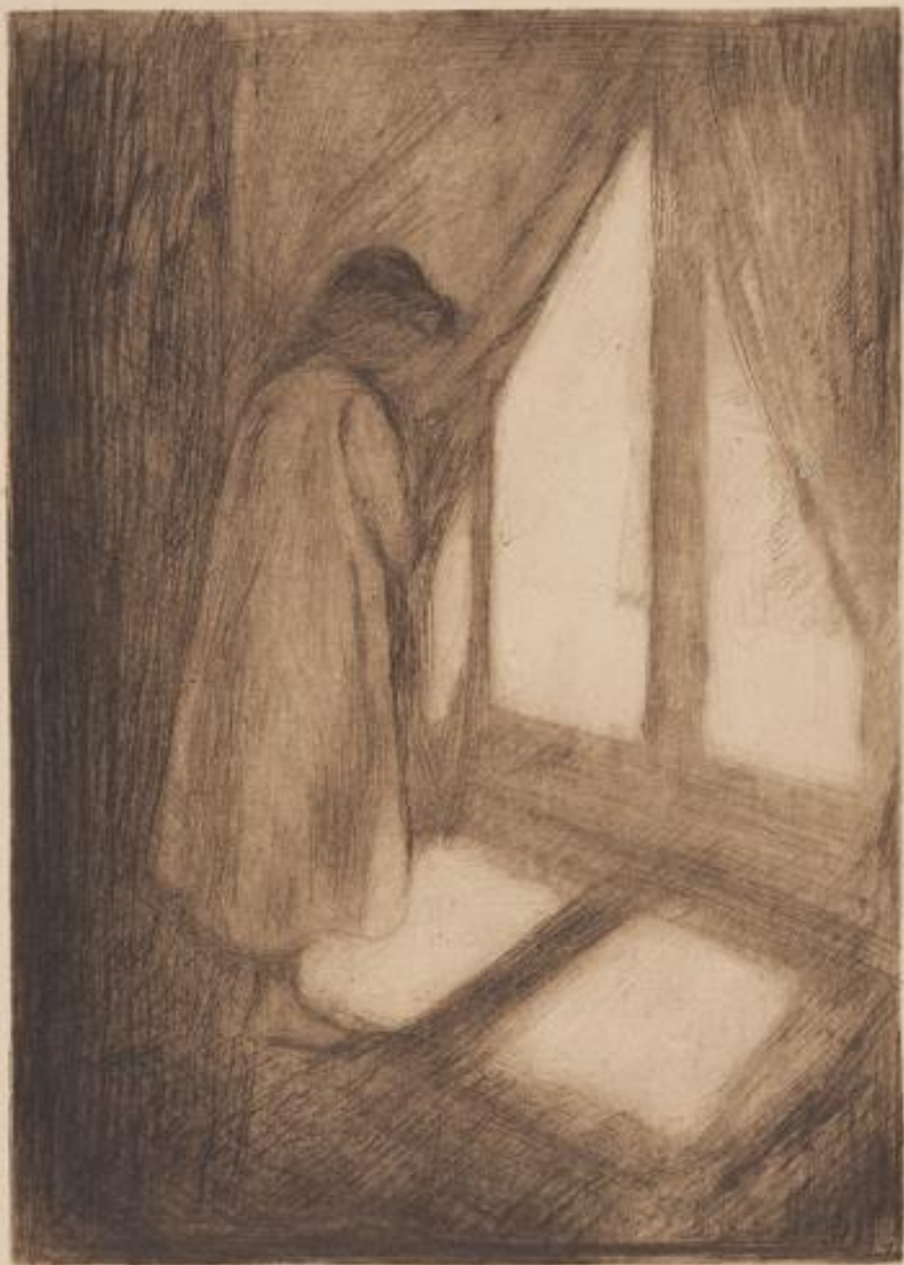
Dziewczynka przy oknie, Edvard Munch, 1912 (wydanie 3.), 1894 (płyta), sucha igła