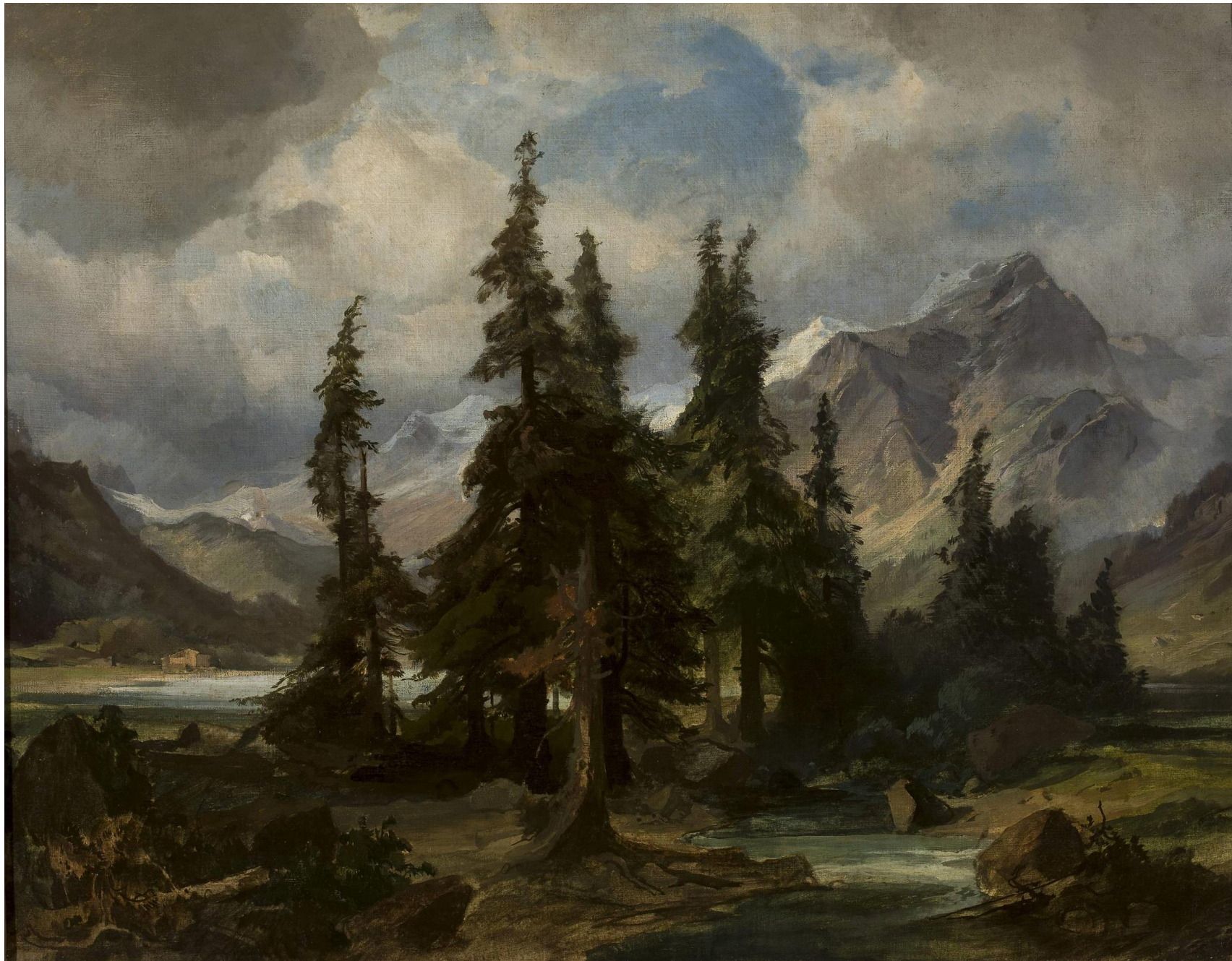
Krajobraz górski z Norwegii, Friedrich Preller, 1840–1850