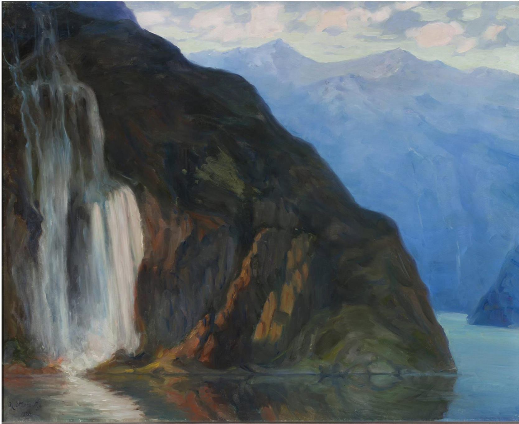
Krajobraz z wodospadem, Kazimierz Stabrowski, 1928