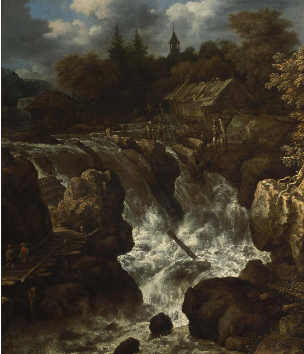
Pejzaż z wodospadem, Allaert van Everdingen, 1670–1680