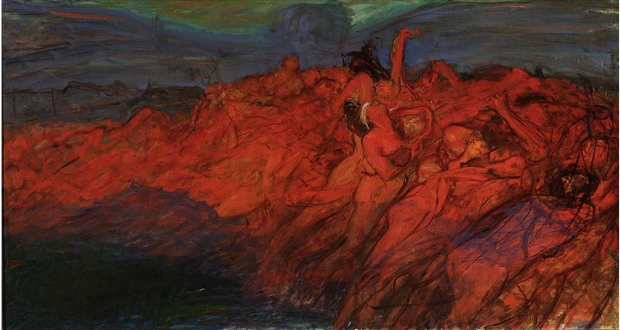
Opętanie , Wojciech Weiss, 1899–1900