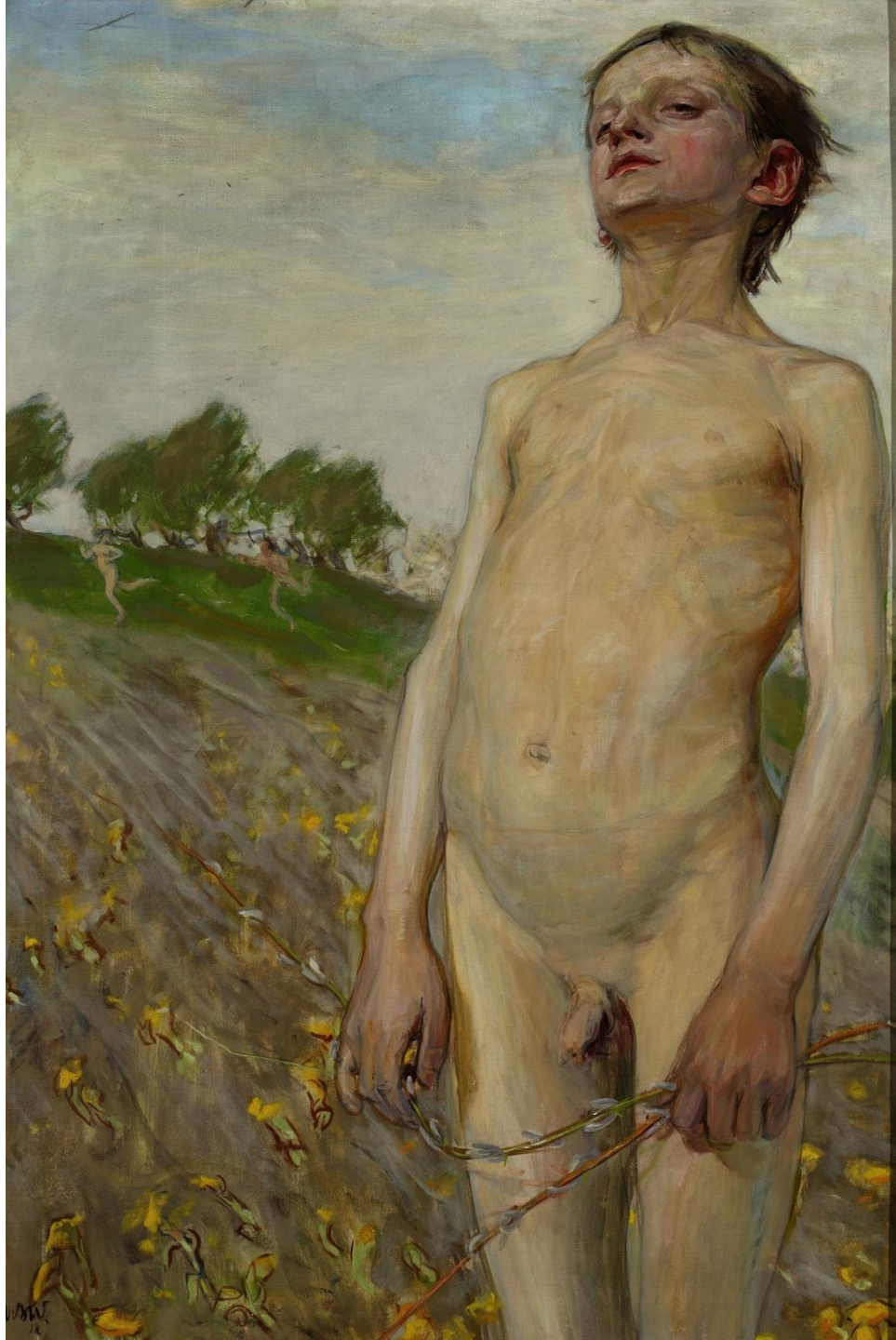
Wiosna , Wojciech Weiss, 1898