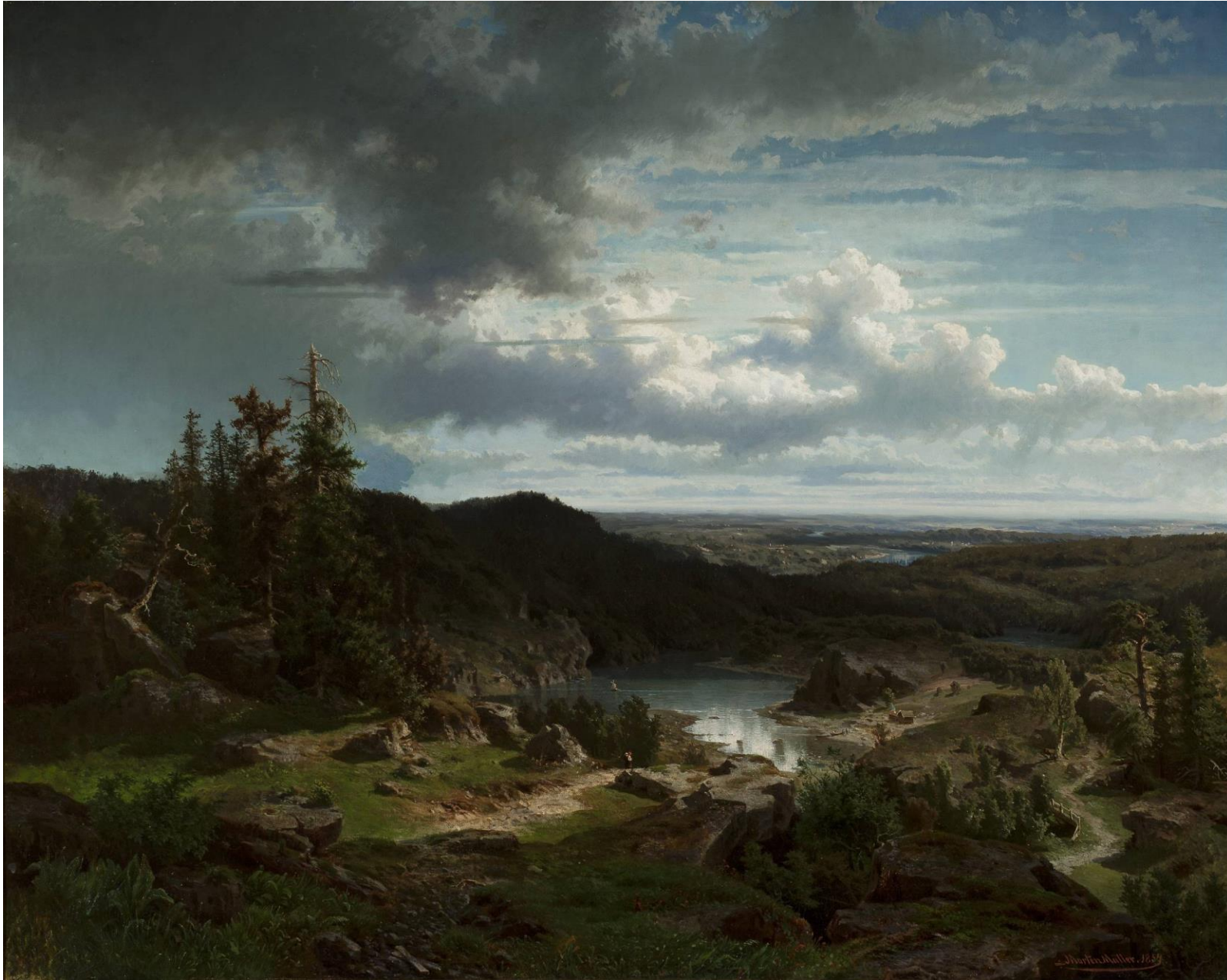
Krajobraz, Morten Müller, 1854