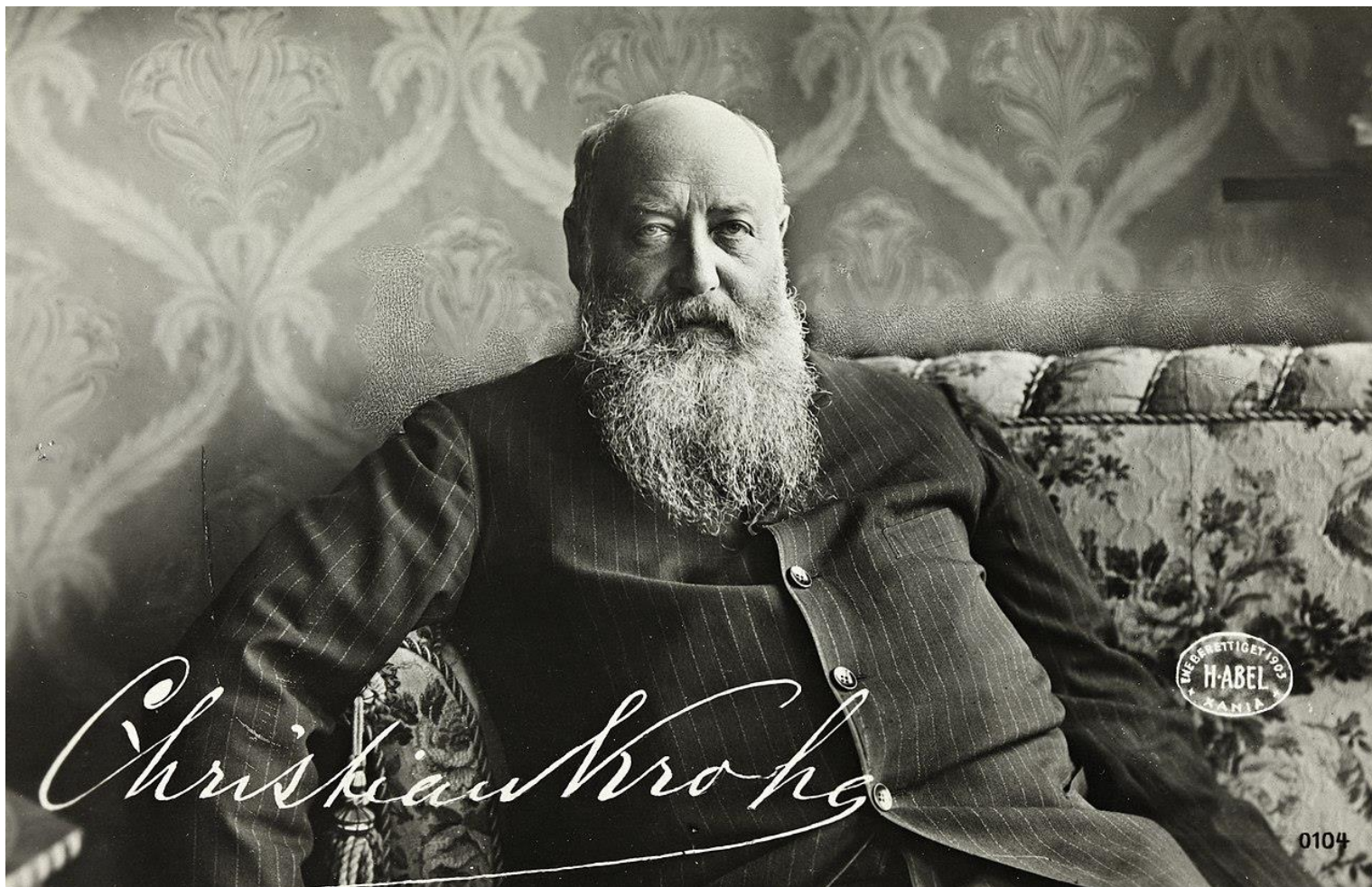
Portret Christiana Krohga, fotograf nieznan, ok. 1903 ze zbiorów norweskiej Biblioteki Narodowej w Oslo