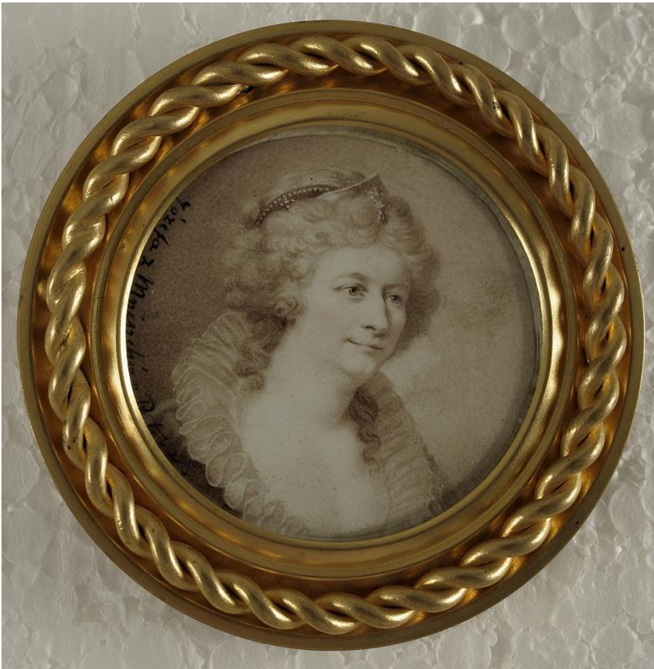
Portret Józefiny z Mniszchów Szczęsnowej Potockiej z Tulczyna, Jan Chrzyciel Lampi (według), 1790