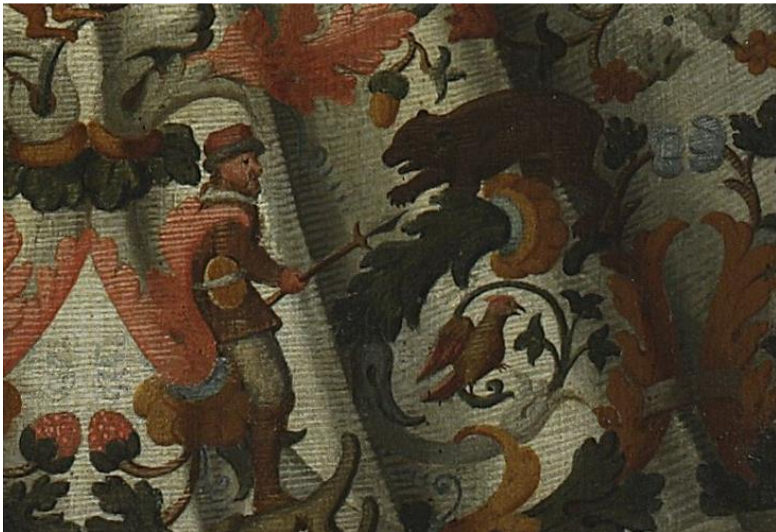
Portret Katarzyny Ostrogskiej, Malarz nieznany, ok. 1597, fragment