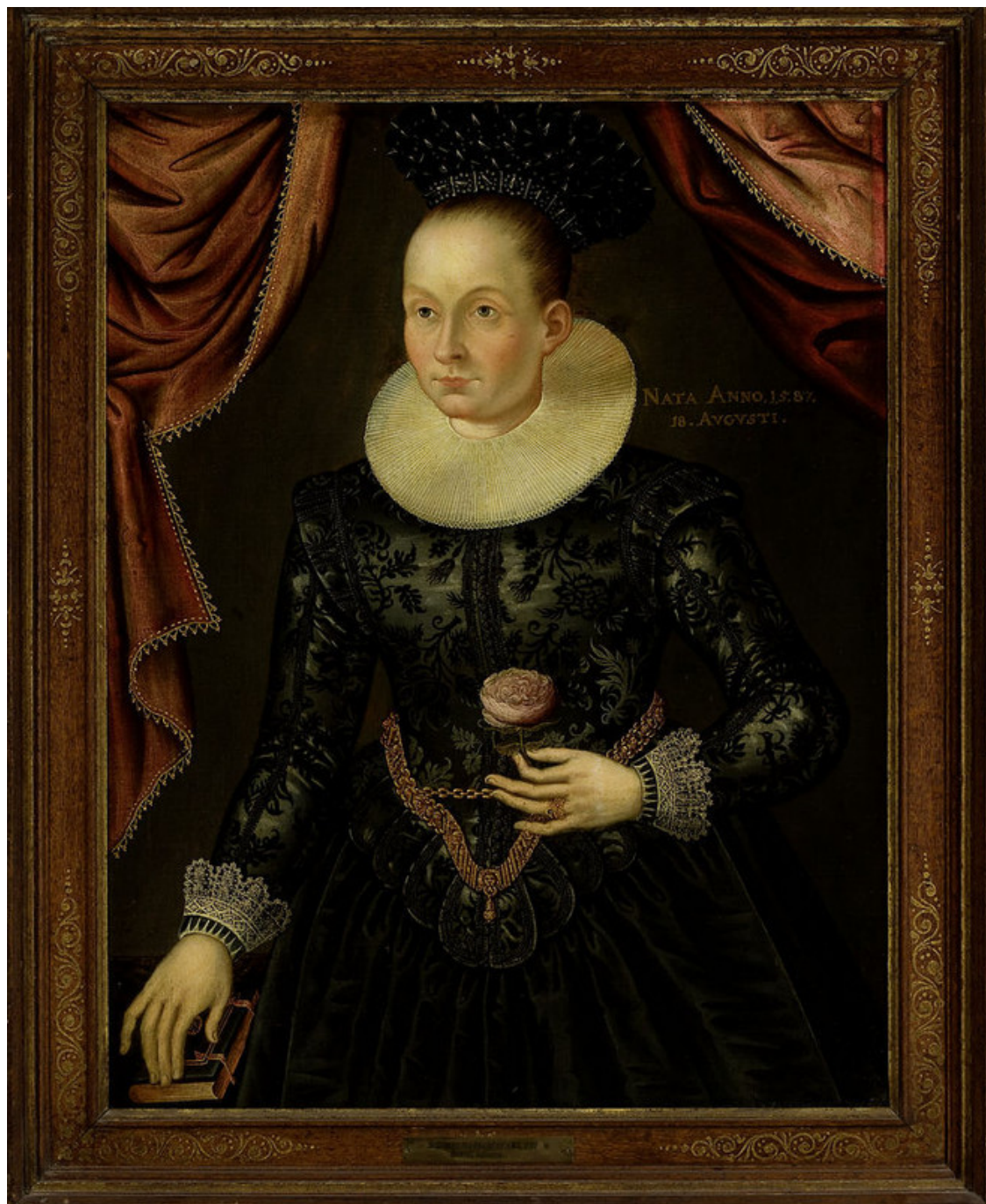
Portret damy z różą, Malarz nieznany, ok. 1600