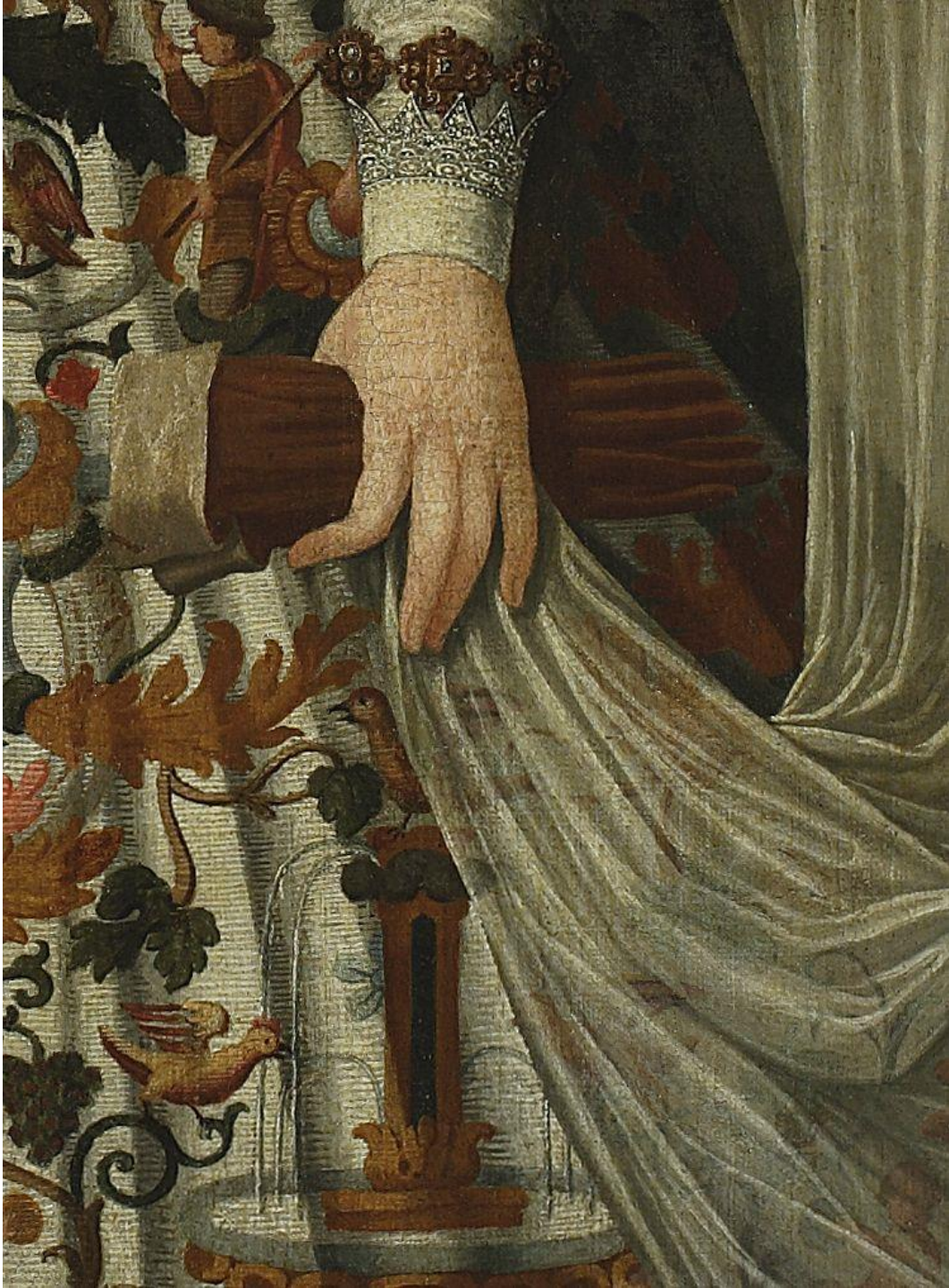
Portret Katarzyny Ostrogskiej, Malarz nieznany, ok. 1597, fragment