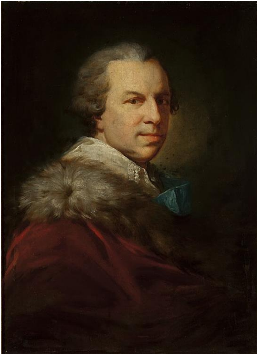
Portret Stanisława Szczęsnego Potockiego, Jan Chrzyciel Lampi, 1788-91