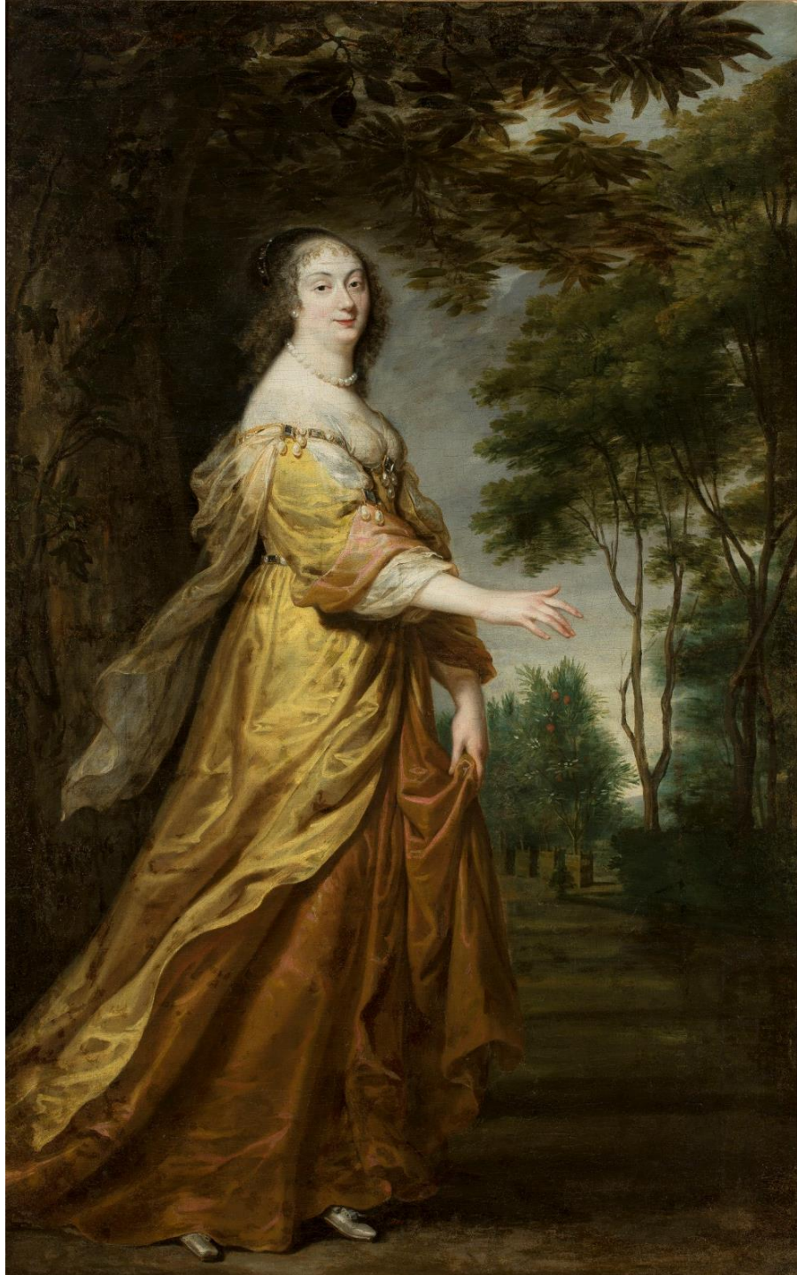
Portret Marii Ludwiki Gonzagi, Justus van Egmont, 1645