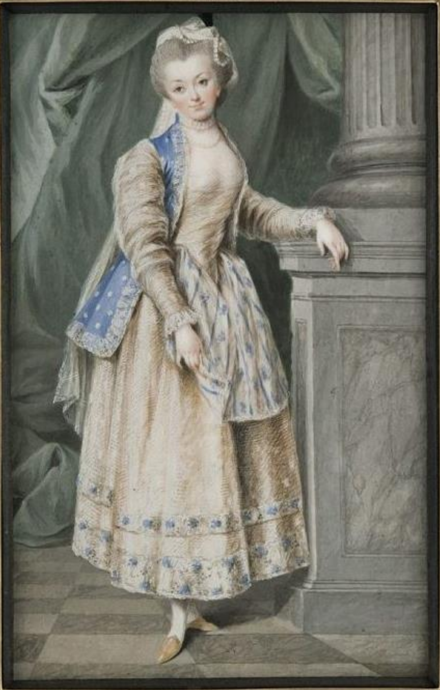
Portret ks. Izabelli z Flemingów Czartoryskiej w stroju polskim, Malarz nieznany, 1785