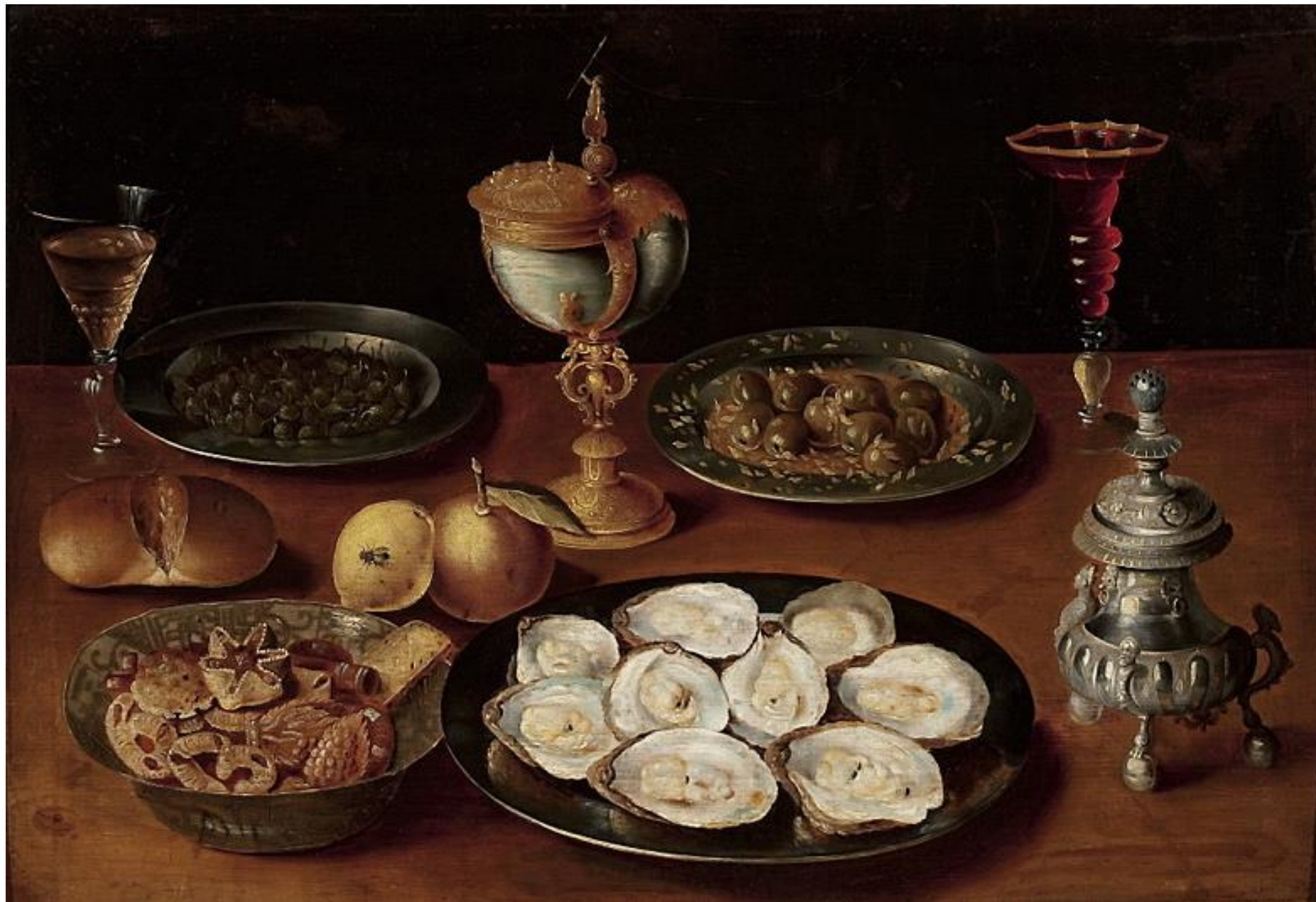
Zastawa stołowa, Osias Beert, pocz. XVII w.