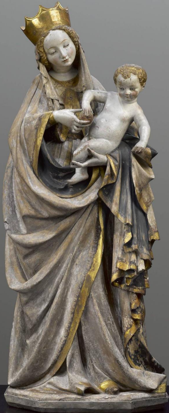
Piękna Madonna z Wrocławia, Mistrz Pięknej Madonny z Wrocławia, Wrocław, ok. 1390