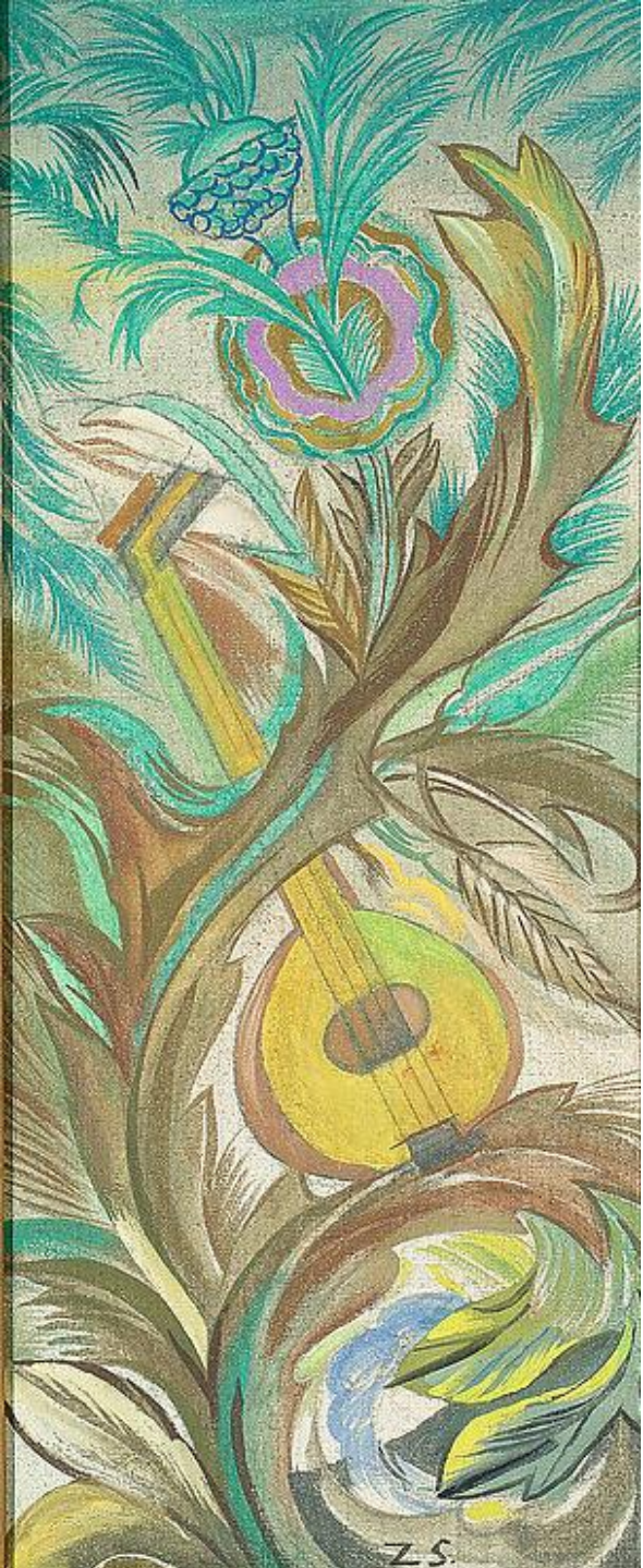
Kompozycja dekoracyjna z lutnią, Zofia Stryjeńska, po 1945