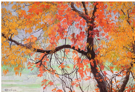
EDWARD OKUŃ (1872–1945), JESIENNE LIŚCIE, 1912, MNW

Projekt „Okno na kulturę” realizowany jest w ramach projektu grantowego „Generator Innowacji. Sieci Wsparcia 2”, realizowanego przez PCG Polska Sp. z o.o., finansowanego ze środków Europejskiego Funduszu Społecznego w ramach Programu Operacyjnego Wiedza Edukacja Rozwój 2014–2020. Partnerem projektu jest Towarzystwo Inicjatyw Twórczych „e”.