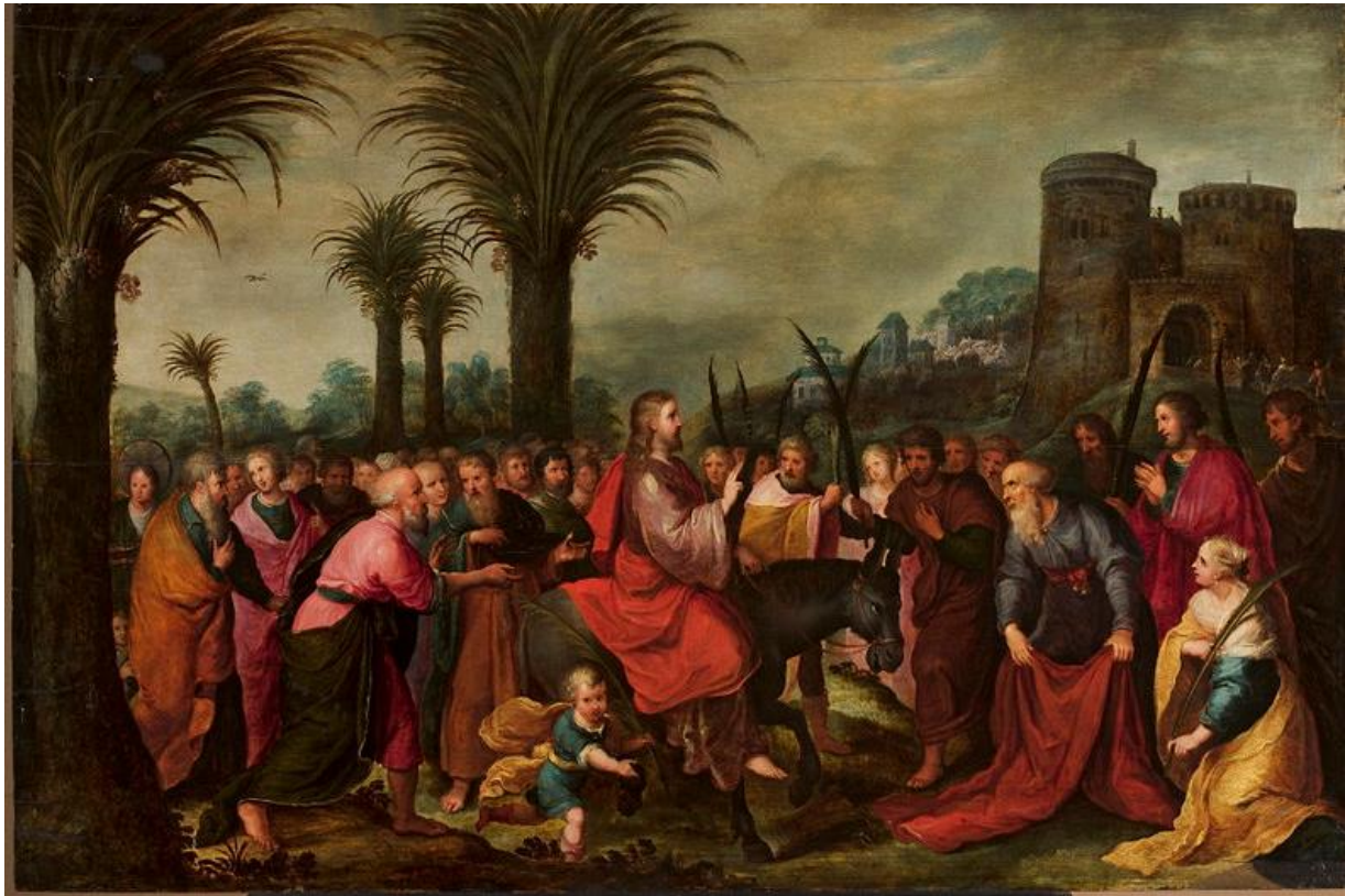
Frans II Francken, Wjazd Chrystusa do Jerozolimy , XVII w.