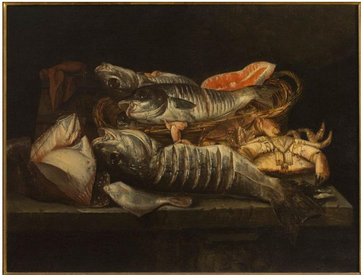
Abraham van Beijeren, Martwa natura z rybami i skorupiakami , XVII w.