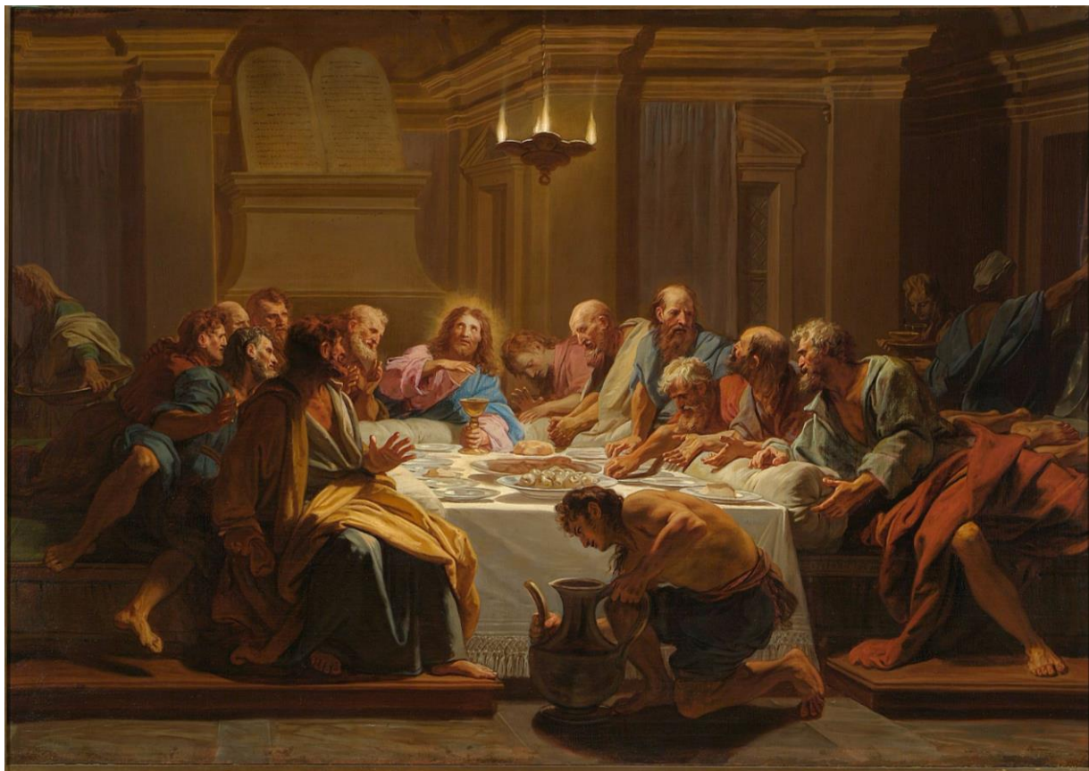
Jean-Baptiste Jouvenet, Ostatnia Wieczerza , po 1704