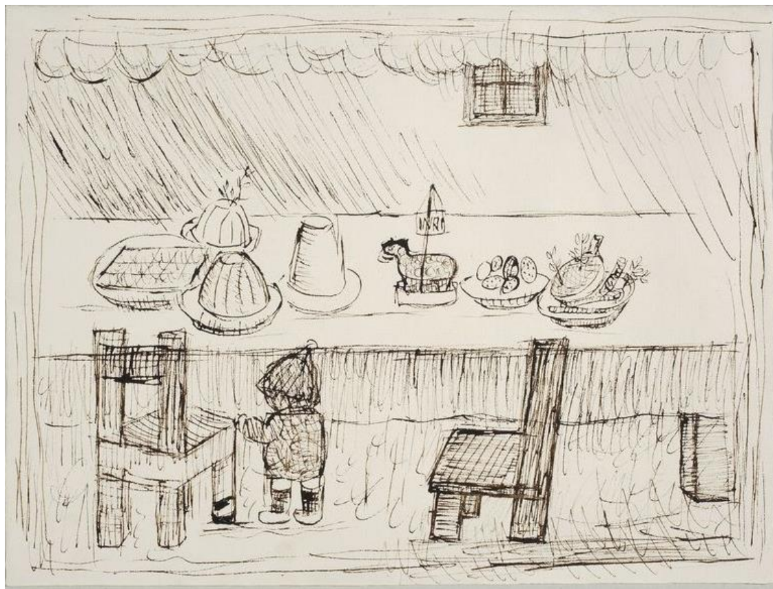
Tadeusz Makowski, Święcone , ok. 1932