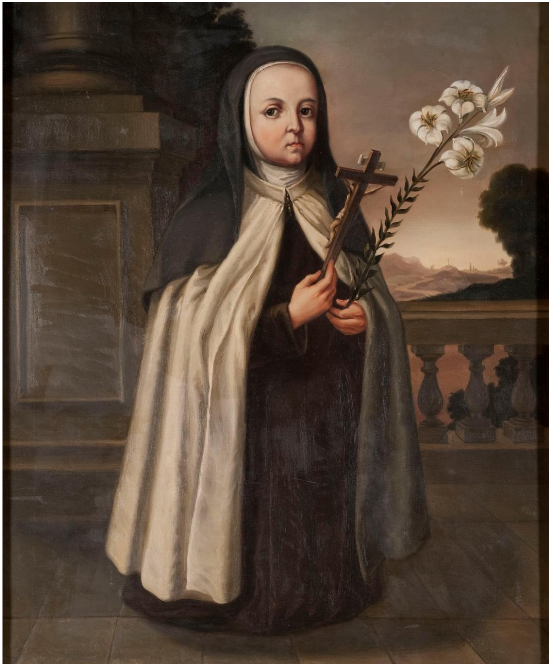
Portret Marii Anny Wazówny w habicie karmelitanek, Malarz nieznanym, 1650-1651